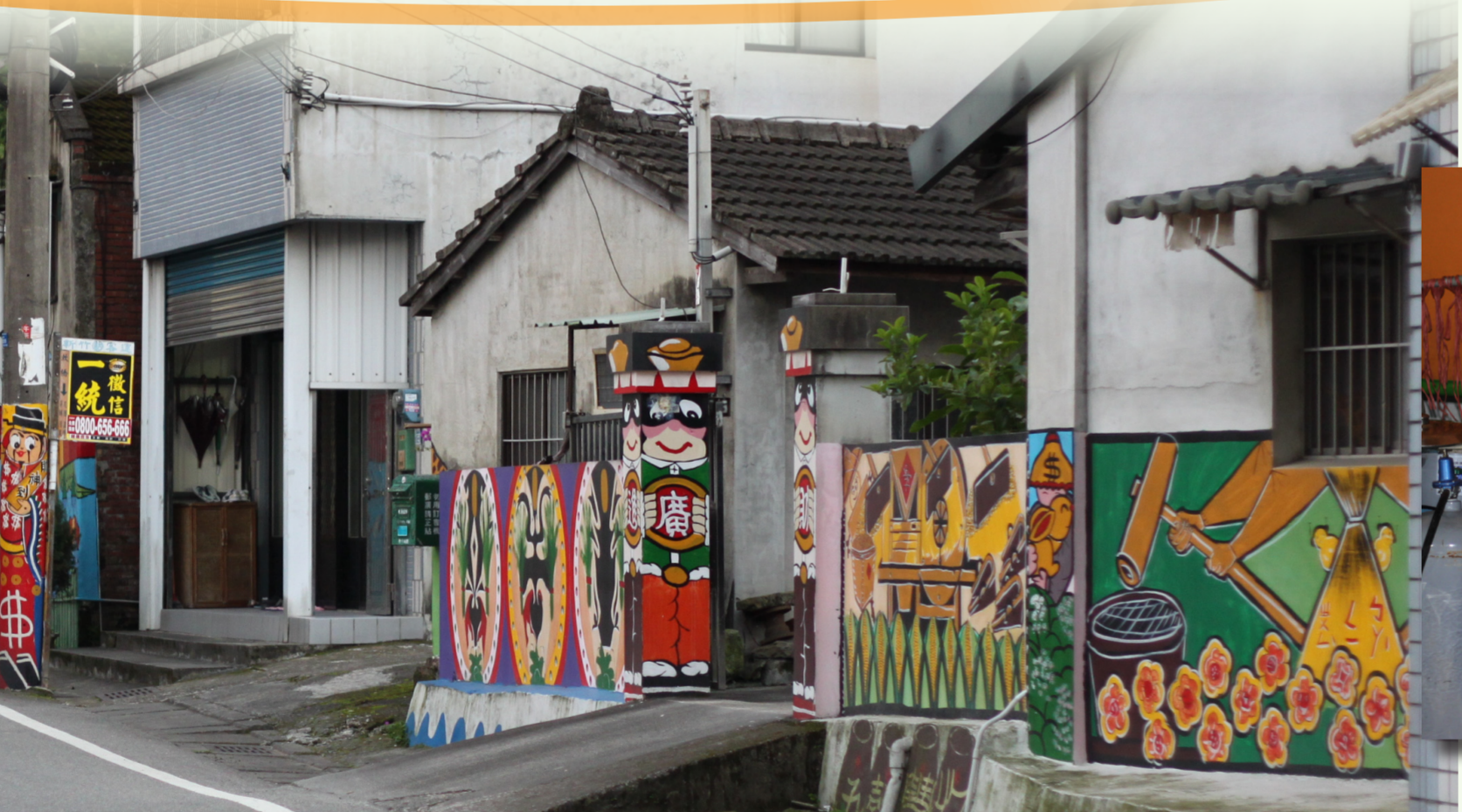
←軟橋社區街景。 ↓軟橋社區的小吃店。