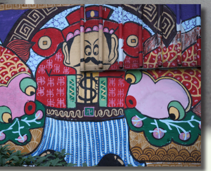
軟橋社區的彩繪圖樣，憨態可掬的土地神。

位於新竹縣竹東鎮的軟橋社區，從二〇〇八年開始進行村落彩繪。耗時三年，將一個原本老舊的客家社區改造成網友口中的「隱藏版彩虹村」，吸引了愈來愈多的遊客到訪。