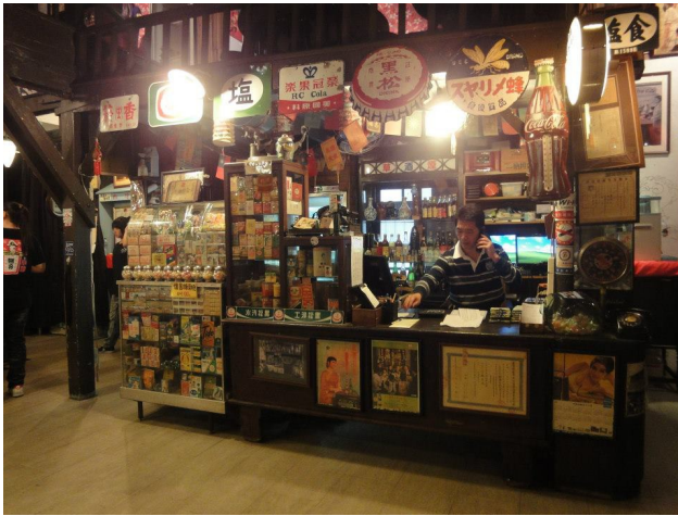
靜靜停留在巷弄中的古早式柑仔店，訴說著大人們小時候的回憶。

沒想到民國九十六年，好不容易打響名號的內灣戲院，竟面臨拆屋還地的窘況。原來戲院門口的土地屬於另一戶人家，幾次的溝通，地主和戲院屋主都無法妥協，眼看這存在內灣將近六十年，幾乎等同於內灣歷史寫照的舊建築面臨被拆除危機，所幸文化界注意到，引起政府介入，將它以文化資產的方式保留下來。