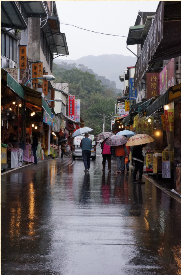
現今的內灣老街，縱使下雨的平日早晨，仍有遊客前來遊玩觀光。

沿著老街恣意地逛，盡頭的那端，佇立著一棟由木板和瓦片組成的古式建築，好似從古至今，它已靜靜地凝望了整個內灣的歷史，看板上提了四個大大的字，「內灣戲院」。