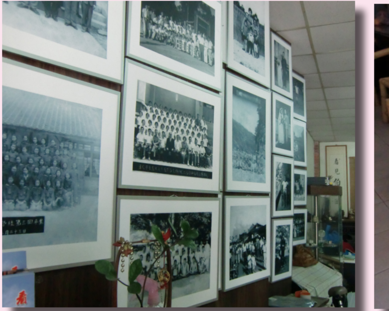
呂宏溥收藏許多當地歷史和家族照片。