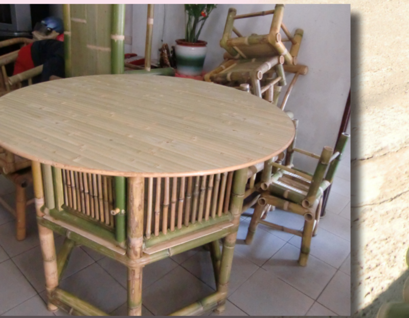
竹編師傅戴阿燻用竹子編織了桌子。