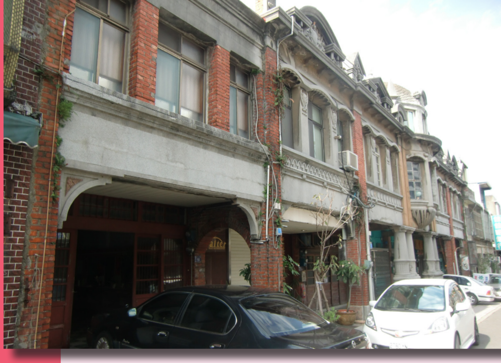
富岡老街裡最著名日治時期純手工打造的呂家聲洋樓。

「好地出在大湖口，金獅朝北斗，長崗來做案，波羅把水口，誰人做得到，黃金萬萬兩。」這段古諺只要是湖口鄉的居民，多多少少都能念上一兩句。「誰人做得到，黃金萬萬兩」表現出當時人們對於土地的冀望，也許期望土地帶來的財富，也許是給自己對土地多一點信心。祖先的盼望傳承下一代，鄉民無一不希望自己的故鄉能有更好的發展。 老湖口與新湖口皆為湖口鄉都市計畫發展的重心，即使一如老態龍鍾的長者，一如春秋鼎盛的壯年，兩者皆是湖口鄉燦爛的明珠。兩者的未來都不不可被忽略，兩地盡力走出自己輝煌的路，創造無可取代的人文風情。