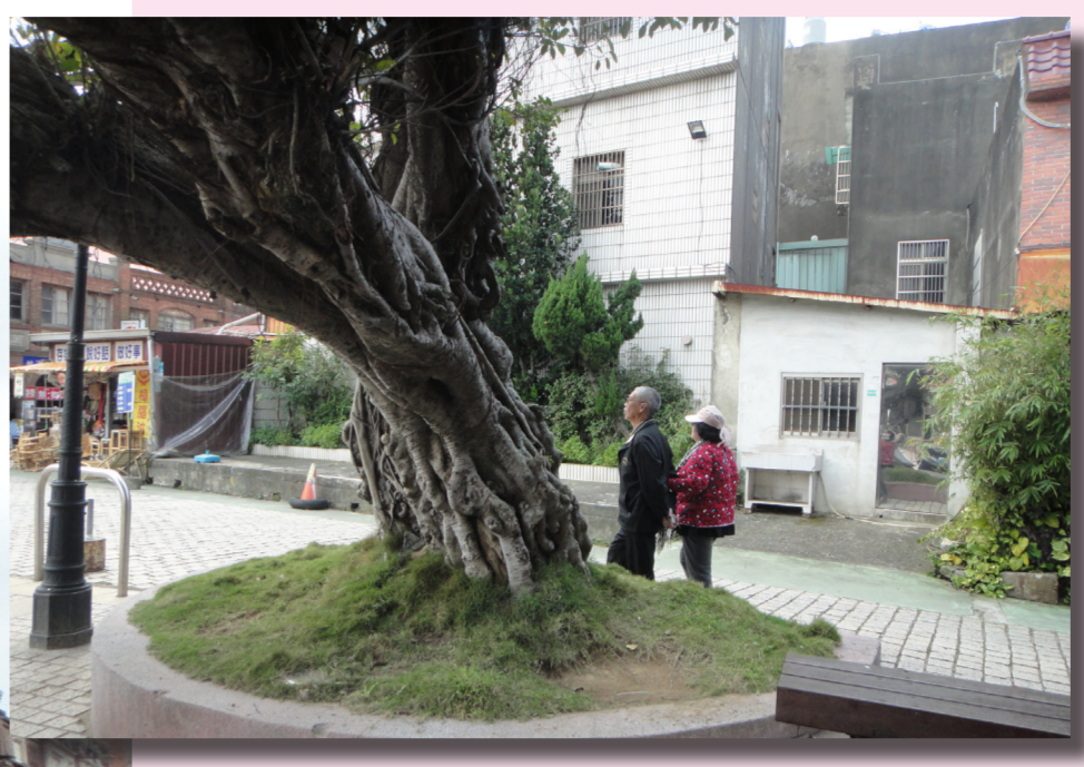
↑即使已無法倚賴湖口火車站的經濟效益，三元宮仍吸引眾多香客前來。 ↑三元宮前廣場，為附近居民的休憩場所。