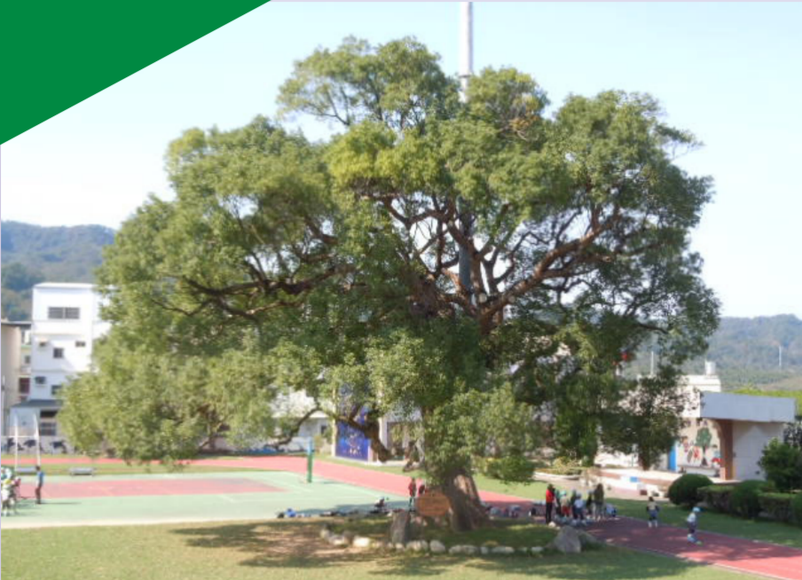
興隆國小校園內的千年大樟樹，是村民們的共同記憶。

苗栗縣銅鑼鄉的興隆社區，舊稱老雞隆，一個保留著自然古樸風格的鄉村，映入眼簾的是一大片農田和傳統的三合院建築，而村內唯一的學校興隆國小，傳來陣陣響亮、有活力的嬉鬧聲，彷彿宣告在這個人口逐漸老化的客家聚落中，有一群新生的小小力量正悄悄萌芽。