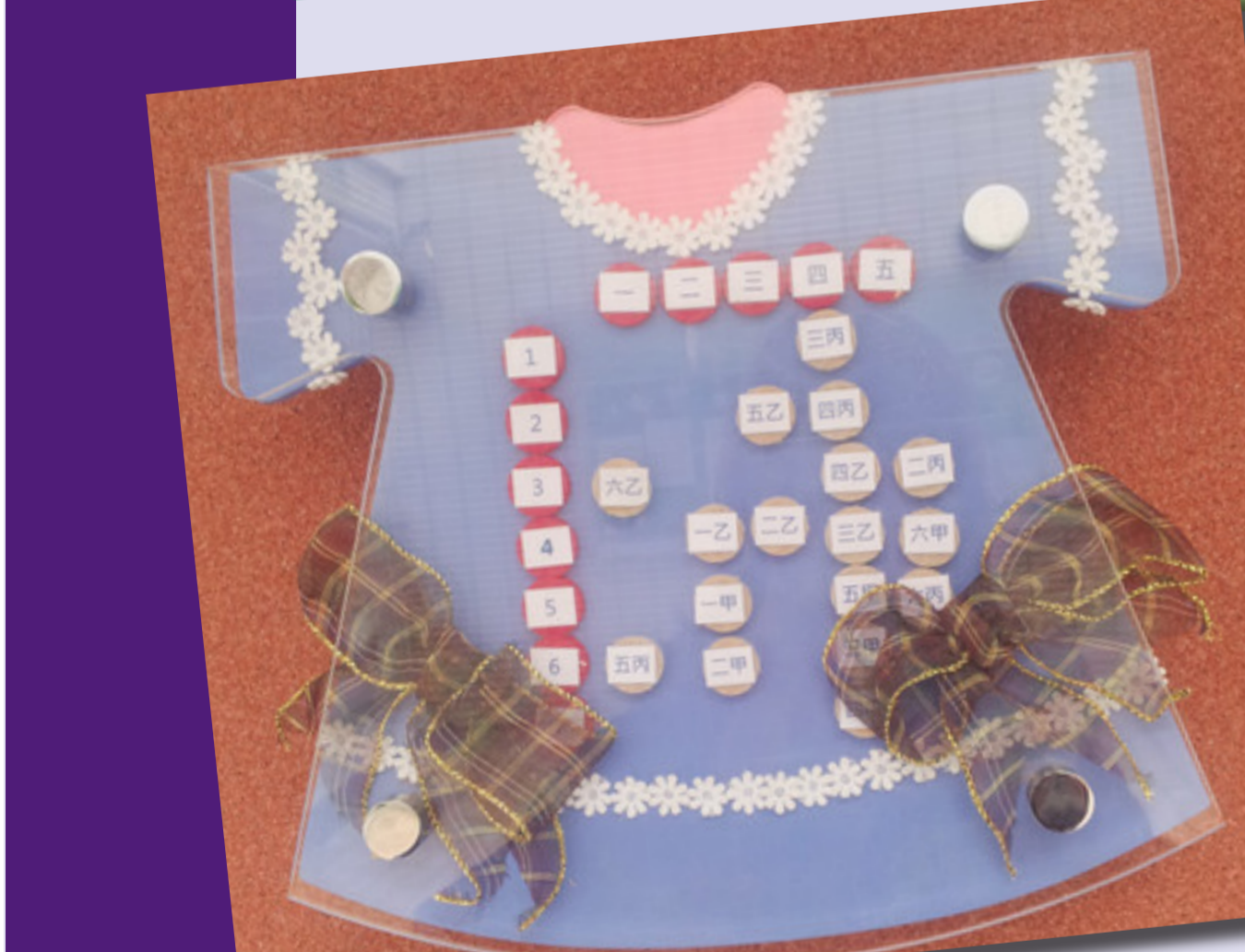
↑以客家傳統服飾作為裝飾的課表。

興隆村舊稱老雞隆，位於龍溪南岸與老雞隆河之間的階地台地上，西隔雙峰山脈，每年四、五月油桐花盛開，「雙峰凌雲雪纓紛」，沿途可見桐花隨風飄落，如雪景一般。村內道路旁也種滿了桃樹、李樹，春天花一開，便呈現「桃花紅，李花白」的秀麗景象。