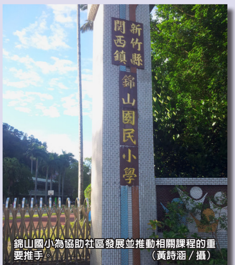
錦山國小為協助社區發展並推動相關課程的重要推手。