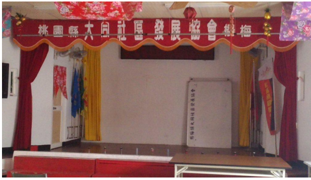
社區活動中心以客家花布裝飾會場。