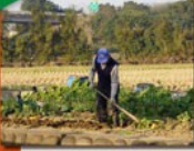
▲ 客家農作活動，展現客家文化特色。