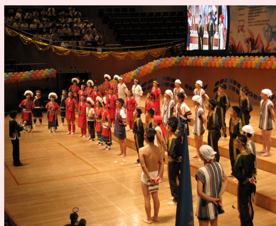
國立大里高中合唱團受邀到上海時表演原住民歌曲，將本土文化帶向國際。

在談論到有關客家的話題時，徐惠君眼神露出的自豪以及興奮的滔滔不絕，讓人強烈地感受到他對客家文化的熱愛。採訪最後她補充了一句：「我覺得客家文化就是博大精深啊！」由於喜愛客家文化與音樂，對她來說，得多少獎項已經不是最重要的事情了，能夠做自己喜歡並且開心的事情人生才有意義。