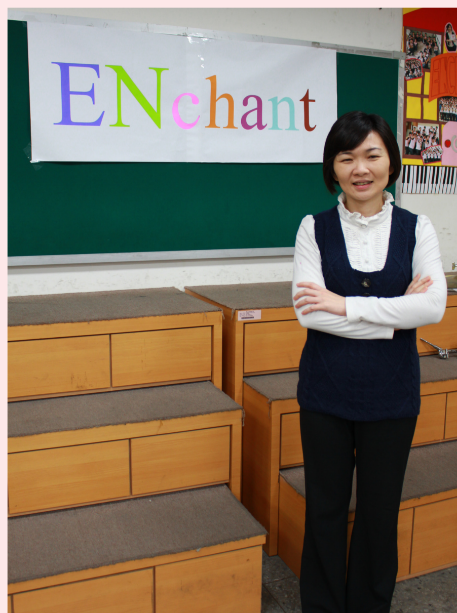
老師背後的是合唱團團名《EnChant》。

教導學生唱各種語言的歌曲時，她注重歌詞的了解，讓學生先用心去體會作曲家為什麼寫出這樣的曲子，對歌曲產生畫面，這樣一來在詮釋陌生語言的歌曲時，聽眾也能感受到歌唱所要傳達的意義。身為客家人的徐惠君特別喜歡參加客家歌謠比賽，甚至也參加原住民歌曲比賽，但參加比賽的目的並不是得名，主要是想讓學生們去感受一下不一樣的文