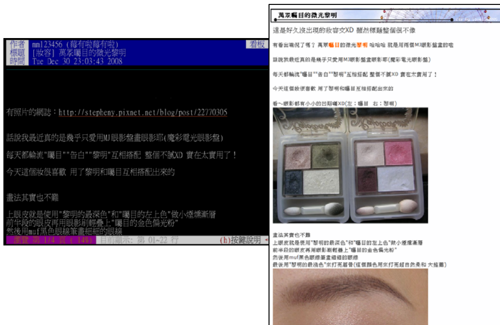
圖一、美妝版與網誌的互相配合 [17]

透過不斷改造身體過程之後的確立（林文琪譯／Chris shilling 原著，2006）。美貌迷思的影響力在美妝版很明顯的已不只是意識層面，透過論述、妝容網誌與照片的分享，電腦中介傳播(CMC)已讓這些論述與影像滲透至女性身體形象，再一次影響了版友的價值觀感與身體改造的落實方針。