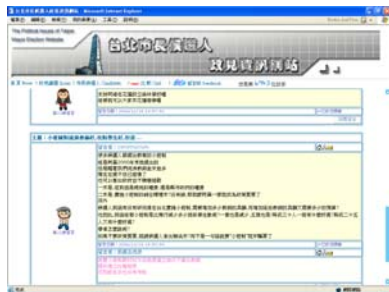
圖 9 政見資訊網留言與對話