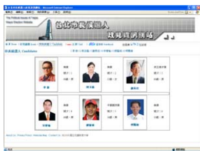
圖3 政見資訊網候選人導向網頁