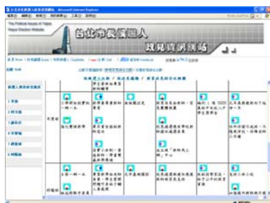
圖 7 政見資訊網政見綜合比較