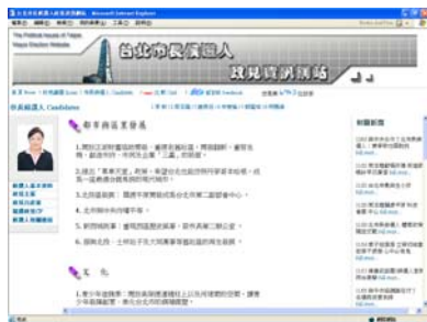
圖 5 政見資訊網候選人政見主 張網頁