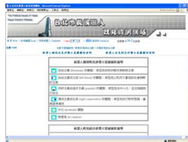
圖 6 政見資訊網政見比較示意 圖