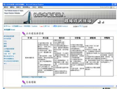
圖2 政見資訊網政見議題導向網頁