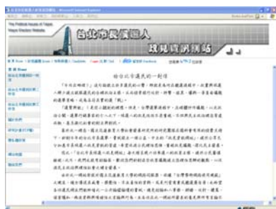
圖1 政見資訊網首頁