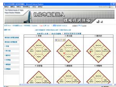
圖 8 政見資訊網政見綜合評價