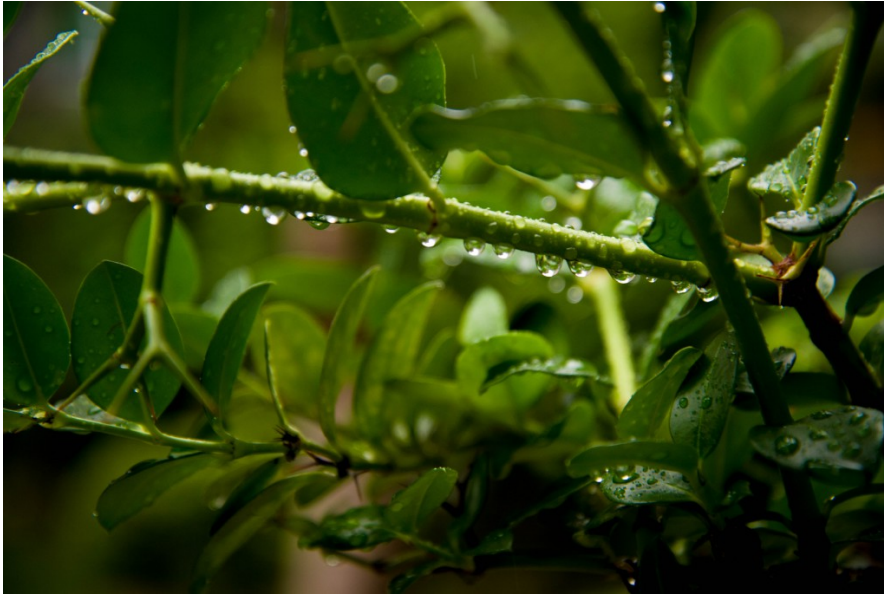
街道旁的路樹枝葉經過雨水洗滌後，更顯嫩綠。