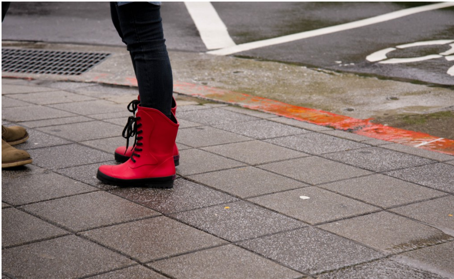
因應雨天，行人換上雨靴以免浸濕腳底。