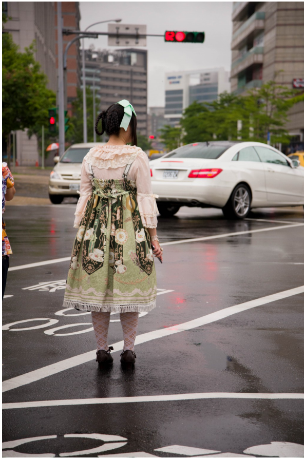
就算陰雨不斷，女孩還是堅持以華麗扮相出現於街上，淋著雨等紅綠燈。