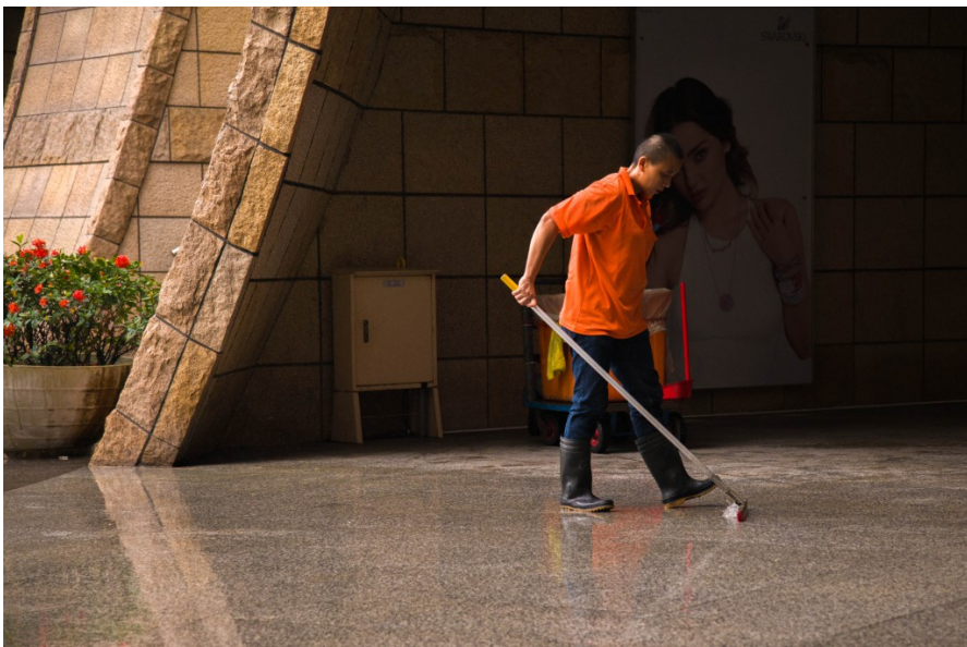
清潔人員忙著將地上積水拖乾，避免行人經過時滑倒。