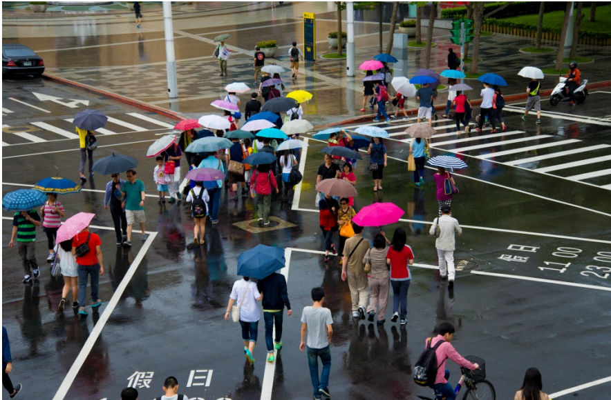
行人們持著各色雨傘，開出一朵朵繽紛傘花。

二〇一五年第一道滯留性鋒面報到，結束前段時間的炎熱天氣，全台進入梅雨季。陰雨綿綿的街道、撐傘的行人、濡濕的地面，形成下雨天獨有的景象。