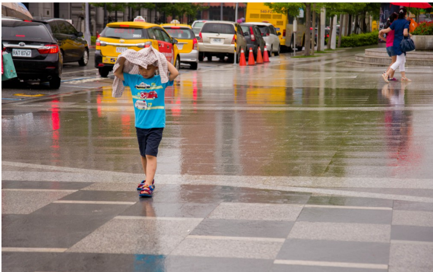
雨一陣一陣地下，沒有帶傘的小男孩脫下襯衫、罩著前行。