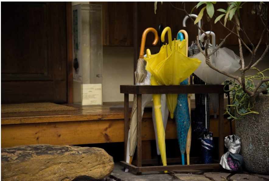
許多人選擇在室內下午茶店渡過雨天午後，店家傘架插滿客人的傘。