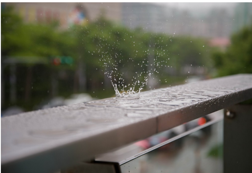
天橋欄杆被雨水打溼，一滴一滴濺起小水花。