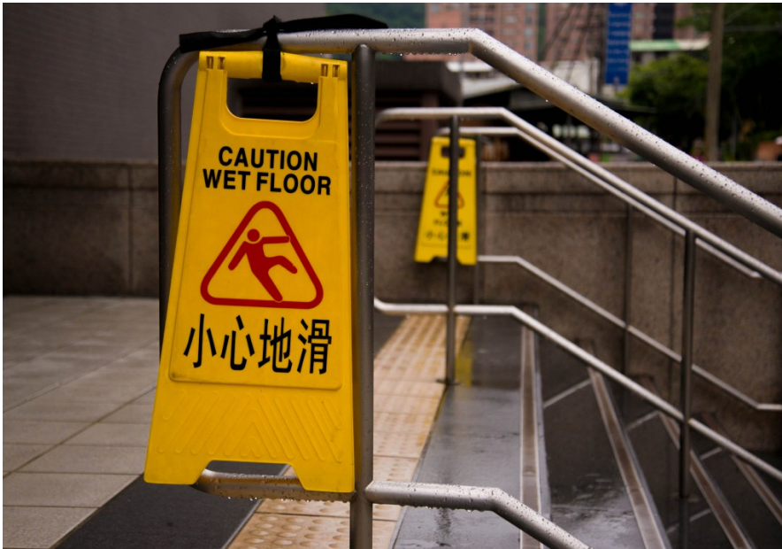
公共場合擺出「小心地滑」警告標語，提醒行人注意安全。