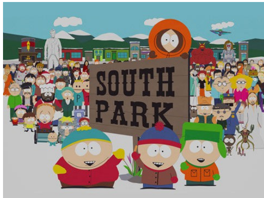
低俗搞笑的《南方四賤客》是許多人童年的回憶

幽默的劇情安排和深度的社會反思讓【南方四賤客】獲得了極高的評價，曾九次入圍艾美獎最佳動畫片提名，並四次獲獎。更在二〇〇六年以「嚴厲的社會評論」、「對美國生活中狂妄自大與虛偽英勇無畏的諷刺」的評價，獲得被視為是「廣播電視界的普利茲獎」的皮博迪獎。