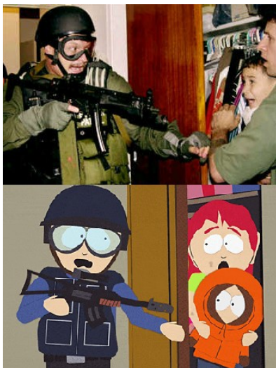
《南方四賤客》對於埃連事件的引用，距離事件發生不到一周。

【南方四賤客】的製作人帕克和斯通認為用一周的極短時間來創作會讓他們更有創意。無論如何，這樣的製作時程讓他們能夠比其他節目更快地對社會時事作出反應。例如在二〇〇〇年美國和古巴因為一名小男孩的監護權和移民資格產生爭議的「埃連·岡薩雷斯事件」，讓【南方四賤客】的製作人停下原先正在製作的內容，改引用這次事件作為題材。在第十二季的第十二集中，【南方四賤客】也惡搞了歐巴馬贏得美國總統選舉的一系列事件，而這集的播出時間距離歐巴馬贏得大選不到二十四小時，其中甚至還引用了歐巴馬的勝選演說。