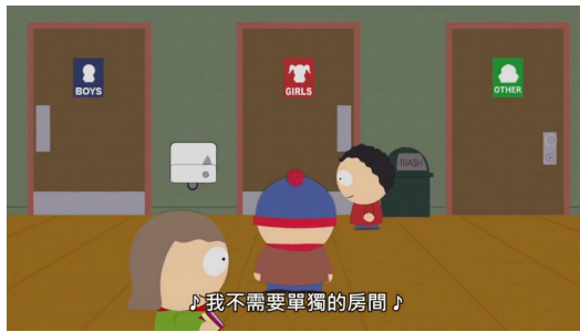
藉由「跨性別廁所」的設立討論性別認同議題。

，以及跨性別者自身的認同，在短短二十幾分鐘盡數呈現。而「蘿兒」這個原先不重要的角色，卻意外成了解決問題的關鍵人物。當屎蛋父親假扮的蘿兒遇到和阿ㄉㄚㄩㄣˊ一樣的處境，公司要為他設立專用廁所時，情感細膩的他卻感受到被排擠的難過而陷入低潮。最後在屎蛋母親的鼓勵下，他才重新振作，寫歌鼓勵大家要「堅持自我」，這首歌感動了大家，學校也因此改變規定，要大家接受跨性別者，無法接受的人才應該要去上特別的廁所。