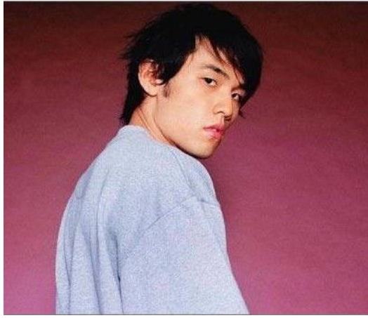
受到肯定後，周杰倫的自信漸增，脫下了那頂「鴨舌帽」。