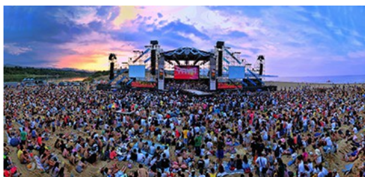
貢寮海洋音樂祭，盛況空前

本國的音樂季之誕生雖是受「烏茲塔克音樂節」(Woodstock Art and Fair) 等外來文化影響，但是從七、八〇年代發展至今，也孕育了不少具本土特色的音樂季。近年所舉辦的音樂季多鼓勵樂團展現自身的獨立性與原創性，期盼創造包容的、冒險的、勇敢的、創意十足而個性鮮明的音樂文化。「貢寮國際海洋音樂季」、墾丁「春天吶喊音樂季」、恆春「春浪音樂節」.....等在台灣舉辦的音樂季，便是結合「獨立音樂」並帶動週邊觀光產業，已是極具知名度的音樂季。如同國外，台灣的音樂季亦成為捧紅歌手的夢想搖籃。蘇打綠、盧廣仲至陳綺貞等人便是從音樂季中發跡，進而受到樂迷的喜愛變成家喻戶曉的明星。