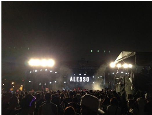
開唱前的舞台已聚集群眾

音樂季將帶著前人的智慧繼續存在，因音樂已是生活中不可或缺的元素。且隨著時間的遞進，如嘉年華會般的音樂季會產生更多彩多姿的面貌，創意將源源不絕地冒出，吸引更多族群參與同樂，共同挖掘更多實力派的歌手。