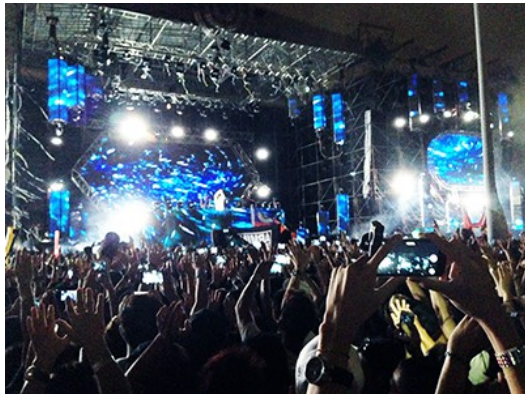
音樂一下，群眾即隨著節奏鼓動

在汗水淋漓的演奏現場，人群隨著音浪搖擺，肌膚也與陌生人偶有接觸，再加上五光十色的燈光效果及混音後的貝斯聲，音樂與肢體融合產生一種奇妙的迷幻感。也許就是這股魅力，每場音樂季總能吸引成千上萬的樂迷前往朝聖。