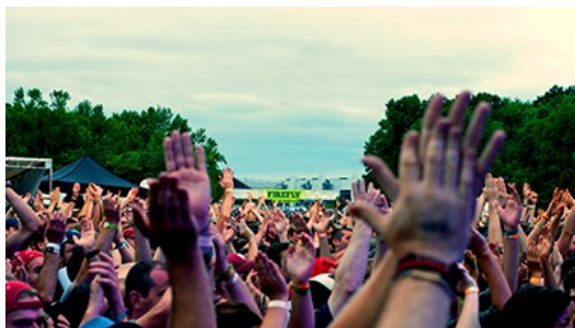
螢火蟲音樂祭推廣環保

從「烏茲塔克音樂節」(Woodstock Art and Fair) 演變至現今，音樂祭雖不再以反戰思想串聯，卻仍可以在許多音樂季中看見其所傳達的理念。美國德拉瓦州舉辦的「螢火蟲音樂季」(Firefly Music Festival) 致力於環保議題與永續發展，提供樂迷們購買綠色通行證，以資助減碳計劃團體。美國俄勒岡州的「皮卡森音樂節」(Pickathon Music Festival)，則打破了「不使用塑膠杯及販賣瓶裝飲料下，不可能舉辦長達三天的大型音樂季」的迷思，使用鋼杯替代那些用量幾乎已達六萬的塑料一次性容器。除此之外，為了達到永續發展的理念，主辦單位將郊區的農場改造為場館，使得荒廢的農場有了更多運用。近年，為了提倡綠色觀念，有更多的音樂祭以「環保」、「永續經營」號召下舉辦，在歡樂同時，也為環境盡一份力。