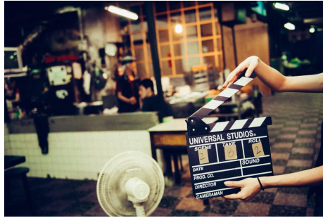
薩禾豐團隊的工作劇照

須繳交一份履歷。通常，能順利選修到該課程的人都是大三或大四的學生，但當年只有大二的他，卻順利通過篩選，成為台下的學生之一。巧的是，那年老師出的期末作業，也是要學生拍一部微電影。薩禾豐絞盡腦汁，想要拍出一部讓自己也非常驚豔的作品，另一方面，他也提到，要讓其他修習那門課的學長姐，能夠看見自己確實有能力和本事坐在台下聽課。「那時候我就想認真拍，我就要那些學長姊知道為什麼我大二，卻可以坐在第一排聽課。」憑著這一股信心，他努力地籌畫這支片子，在當時沒有相關資源的情況之下，他自行到台北租借器材、研究怎麼拍攝會有更好的效果，種種細心和認真地準備之下，他完成了一部當時他覺得最好的一部作品。儘管現在看來，那部作品對於薩禾豐並沒想像中那麼好，這仍是在學期間的一個里程碑。