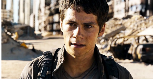
男主角對未來沒有把握，心情動搖。

今年上映的【移】，目前網路上正評依舊多於負評，雖然有意見表示本集故事角色發展不夠鮮明，但是導演成功營造的緊湊節奏還是讓觀眾看得心驚膽戰。歐布萊恩更是將男主角的正義感，以及偶爾露出的迷茫和疲態飾演得淋漓盡致。他將湯瑪士矛盾的心情完整的呈現在大銀幕上，讓觀眾看見他在帶著同伴逃離了神秘組織的基地以後，眼神中的堅毅與偶然的自我懷疑。