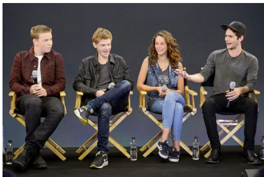
歐布萊恩與劇組成員感情融洽，一同接受採訪。

靠著【移】成名的歐布萊恩一瞬間感受到世界的目光朝他身上聚焦，名氣伴隨著壓力排山倒海而來。但是他絲毫不改那樸實而幽默的個性，反而更加謙虛的檢視自己。當續集開始拍攝，他也在採訪中表示自己的表現並沒有達到標準。除了透漏他不認為自己的動作夠帥之外，他更說：「我不把自己定位為動作片明星，只有超級厲害的人才得以這樣做。」在拍電影的餘裕中，他更是和劇組中其他人打成一片，一點也沒有主角的架子。