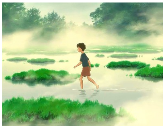
充滿濃霧的沼澤象徵著杏奈迷惘、不安的心情。

【回憶中的瑪妮】有許多杏奈進入自己意識流中的畫面，以較抽象的方式描寫杏奈的內心世界，而「沉睡」是她進入內心世界的開關。或許有人會認為以杏奈的年紀，多次突然失去意識進入睡眠顯得有些不自然，但這也是導演給觀眾的一個暗示，暗示杏奈正要沉入自己的幻想之中。除此之外，「沼澤」在該片也擔任重要的角色，沼澤以及沼澤中央的沼澤屋是杏奈與瑪妮每次相會的地方，隨著杏奈的心情起伏，沼澤的景色也會隨之改變。當杏奈迷惘時，沼澤便會充滿濃霧；當杏奈內心平靜時，沼澤的水面便會安靜地連一波漣漪都沒有，可以說導演利用沼澤訴說杏奈的心情故事。