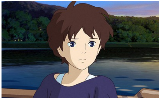
自卑的杏奈，眼神中總是帶著淡淡的憂鬱。

人生是一段尋找自我的旅程，在這趟旅程中，透過自我對話，找到專屬自己的生存之道。以【龍貓】聞名的吉卜力工作室於二〇一四年秋季推出的動畫電影【回憶中的瑪妮】（思い出のマーニー），描述主角杏奈透過無數次自我對話後成長的故事，這部影片細膩地刻畫出杏奈內心的改變，從原本自卑、討厭自己，蛻變成一個開朗、幸福的女孩。