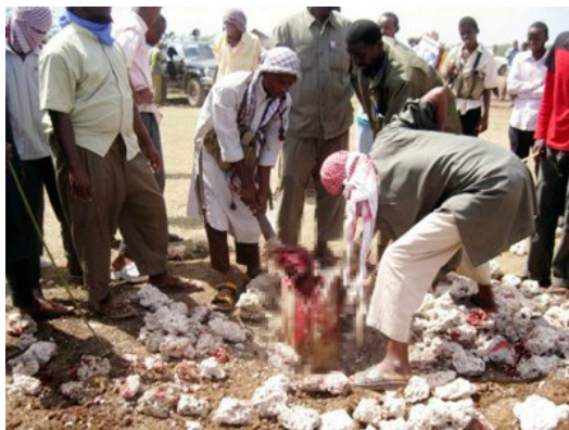
回教國家目前仍有通姦罪處以石刑的制度。

傳統社會中，是用兩個不同的標準衡量男女對於婚姻的不忠，甚至到現在仍有這種觀念存在。書中提到「對男人而言，這是『愚蠢的錯誤』。對女人來說，這是精神犯罪，她有愧於身旁所有愛她支持她的人，她的夫婿，她的孩子。」幾年前，成龍以一句「我犯了一個全天下男人都會犯的錯！」向大眾承認他外遇的事實，而後背叛婚姻的男人都用此藉口，將自己的迷失歸咎於男人的原罪。至於女人，一旦被發現出軌，好像應當受眾人亂石打死的懲罰，因為她欠缺自尊又出賣肉體，還會一輩子被冠上不守婦道的罪名，永遠無法原諒。看似男女平權的社會，潛在刻板印象的不平等，《外遇的女人》將性別的矛盾、對比，做了大篇幅的著墨。