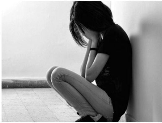
當人在追求完美人生的同時，常常忘了自己的快樂。