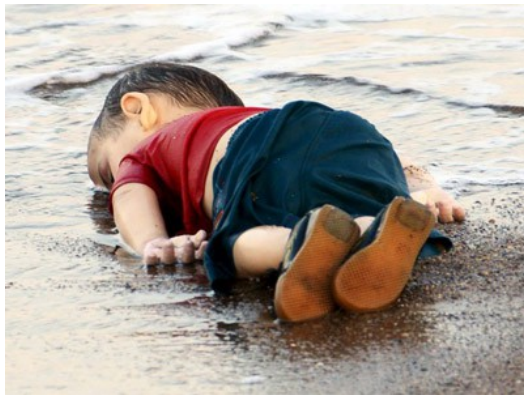
世界動亂不斷，但只要愛存在，悲劇終將得到救贖。 圖為敘利亞一名三歲男童，因為難民船的翻覆，而伏屍在海灘上。

本書以《外遇的女人》為名，直截了當地用五個字概括全部。若只看書名，大部分讀者會帶著負面情緒閱讀，畢竟對愛情的不忠誠，很難被接受。一個女人獨自面對愛情的掙扎，求助巫師、醫師都改善不了她的心理狀況，最後只能靠自己找到出口。經過作者巧妙的安排，讀完琳達的故事後，並不會感到氣憤，只會剩下滿滿的同情。作者想傳達的「愛」，不是唯獨愛情這麼狹隘，而是對於人世間的所有情感。或許某一天，世界也能因為這份無私的愛，讓所有無力改變現狀，身體、心靈陷入苦難的人們，得到永恆的救贖。