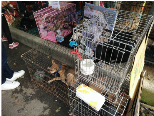
等待認養的大隻。

為了解決流浪動物問題，不論是政府或是相關單位，都持續在宣導「認養代替購買」的觀念。「購買」的方式，多半有著純種迷思，飼主殊不知這種迷思正是惡質動物繁殖場的溫床。不肖廠商看準純種寵物商機，讓純種動物不斷繁殖、近親交配，在這種情況下生出來的後代常常身患遺傳疾病，在照顧方面就要比混種寵物多費心思，如果因而覺得麻煩，是否又會再多出一件棄養事件呢？而繁殖用的種貓種狗，同樣也是收容所的常客。