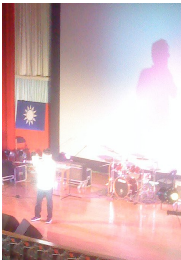
高中社團生活不乏表演機會，而我多以獨唱為主。

社團生活相當精彩，讓我認識了許多音樂上的知己好友，且有不少的表演機會。而社團的學長姐有找一位指導老師，並安排在社課時間指導我們歌唱技巧。指導老師經常鼓勵我們多上台、多比賽，即使歌聲未能征服眾人，也算是不枉青春了。於是就在這些日子，我漸漸發掘了我對歌唱的興趣，以及對流行音樂的那種熱忱。