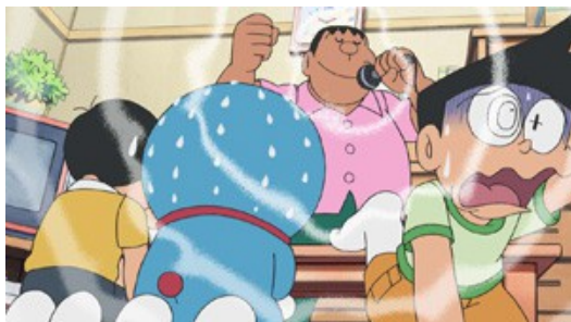
胖虎是卡通《多啦A夢》中的一個角色。 其歌聲非常大聲尖銳卻不自知，常造成眾人困擾。 我曾以他為借鏡自我反省。

然而，高音能力的提升，並不代表整體實力的進步。大學後參加的歌唱比賽，表現大多不太理想。另一方面，高音上的優勢，更加容易凸顯我中低音方面的缺點，且音量控制上更加難以拿捏。因此，有段時間悶悶不樂的我，常常在內心以「胖虎」自我比喻，作為借鑑。唯一較為起色的成績，是四、五月的臺大音韻獎，當時我的成績與晉級決賽的標準差距相當小。其實，那一次賽前狀態調整的不錯，不過在最高音的時候，由於口腔離麥克風過近，導致音響爆音的情形，感到相當惋惜。