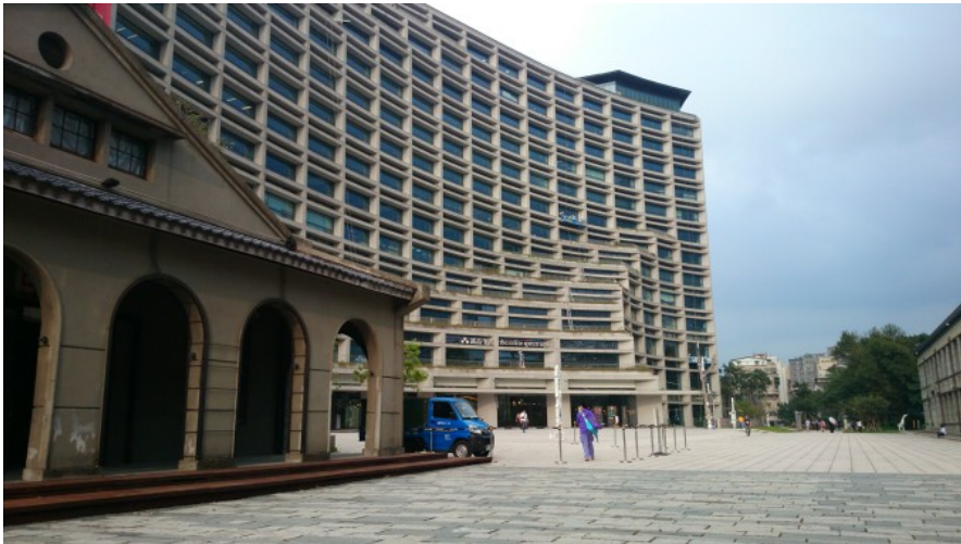
一直和松菸爭議有關的台北文創大樓，相較之下更像是松菸的主體。