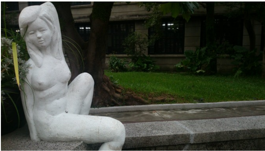
在花園區擺放和松菸不相干的粗糙塑像，讓人懷疑規劃者的想法。