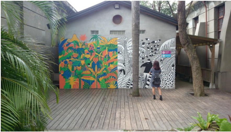
而園區中的彩繪牆，雖然只是平面繪圖，卻能讓人感受到設計存在於生活周遭。