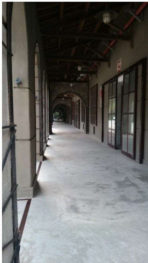
舊倉庫外的走廊，和習慣的現代走廊風味不同，更能夠激發想像力。