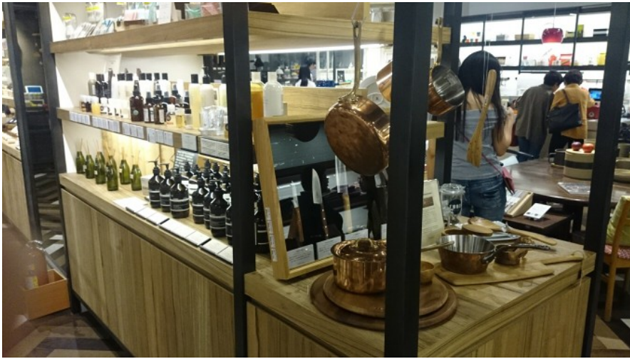
文創大樓裡販賣的精油和鍋具是文創嗎？