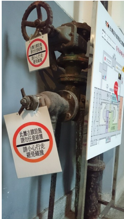
然而小地方例如告示的設計，應給予些巧思讓文創能夠體現於生活中，而非隨便的禁止告示。