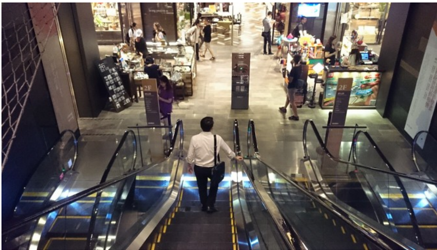
從電扶梯由上往下看，百貨公司是最貼切這個場景的形容。