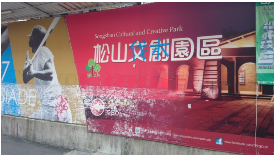
捷運出口外被破壞的松菸告示牌，暗示了松菸文創的爭議將會繼續延燒下去。