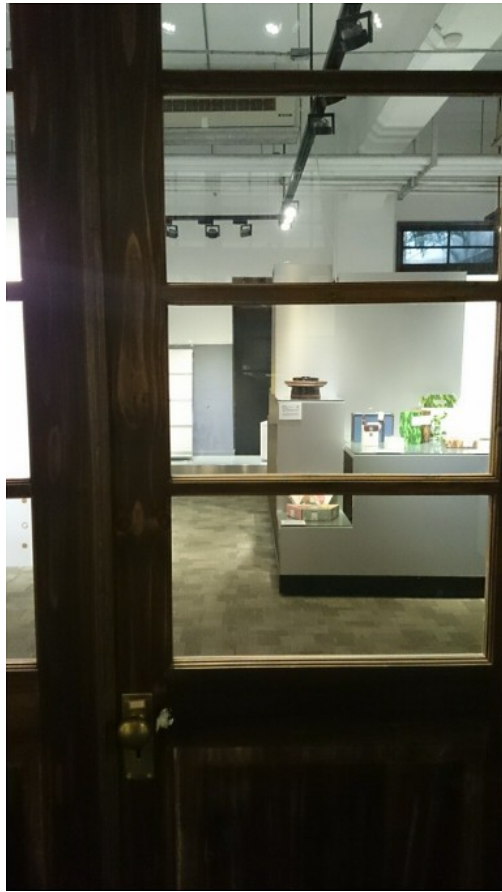
松菸中的展覽品就像和人們隔了一扇門般，讓人無法體會到設計在生活中的重要性。