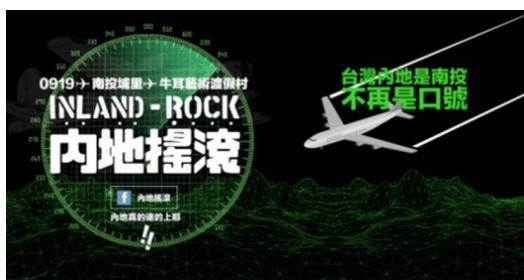
臺灣群眾募資專案，喊著「台灣內地是南投」的口號進行宣傳。

過去英美的藝術家與音樂家因為預算不足，政府撥的預算亦不足以負擔，向銀行貸款更是難上加難，因此常常迫不得已已在網路上發起群眾募資，希望籌措足夠的資金發展文創產業。曾經也有民眾因為想要邀請有名的樂團到當地進行巡演，而發起群眾募資，最後成功邀請樂團的例子。音樂、文創和藝術在當時是群眾募資的主要範圍。但是現在的群眾募資已經不只以文創為限，更有小型企業、新創團隊、公益團體或是果園小農到平台上進行募資，希望籌措資金，將自己的團隊或是想法發揚光大。