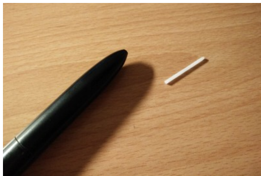
繪圖筆的筆頭可以抽出替換。

除了外出需要小心以外，平常的保養也是蠻重要的。有時候冷落她太久，積了很多灰塵，就必須好好的清理。至於筆的部分，因為在畫圖時筆頭會一直摩擦，導致磨損，磨損情況太嚴重的時候就必須更換了。我第一次換筆頭的時候覺得很有趣，因為曾經覺得不可能拔得起來的筆頭，只要用夾子輕輕夾著抽出來就成功了。