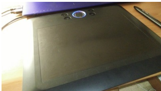
我的繪圖夥伴「黑美人」。

以前在向別人介紹的時候，我都是用本名稱呼她，但是日子久了之後，覺得她本來的名字有點無趣，所以我就根據她的外表取了一個暱稱，叫做「黑美人」。說起來用外表幫別人取綽號似乎有點膚淺，但她並沒有為此鬧脾氣，所以我就當作她已經接受了。