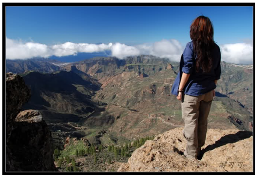
人生的巔峰，只有面對自己的挑戰才能取得

作家維克多·雨果 (Victor Hugo) 也曾經說過「所謂活著的人，就是不斷挑戰的人，不斷攀登命運峻峰的人」，而人的一生中一定或多或少的會遇到各種挑戰，但只要不放棄，並且去面對它，最後我們每一個人都能到達自己生命中的巔峰。