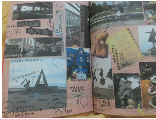
作者的附註有些複雜可能使讀者無法搞清先後順序。