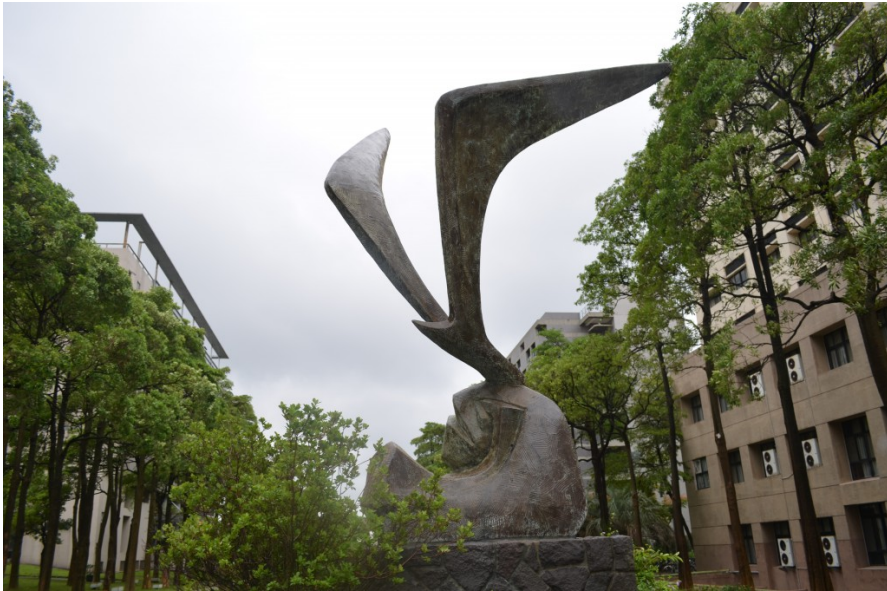
〈海鷗〉以簡潔有力的線條營造鷗鳥翱翔於海天的畫面。