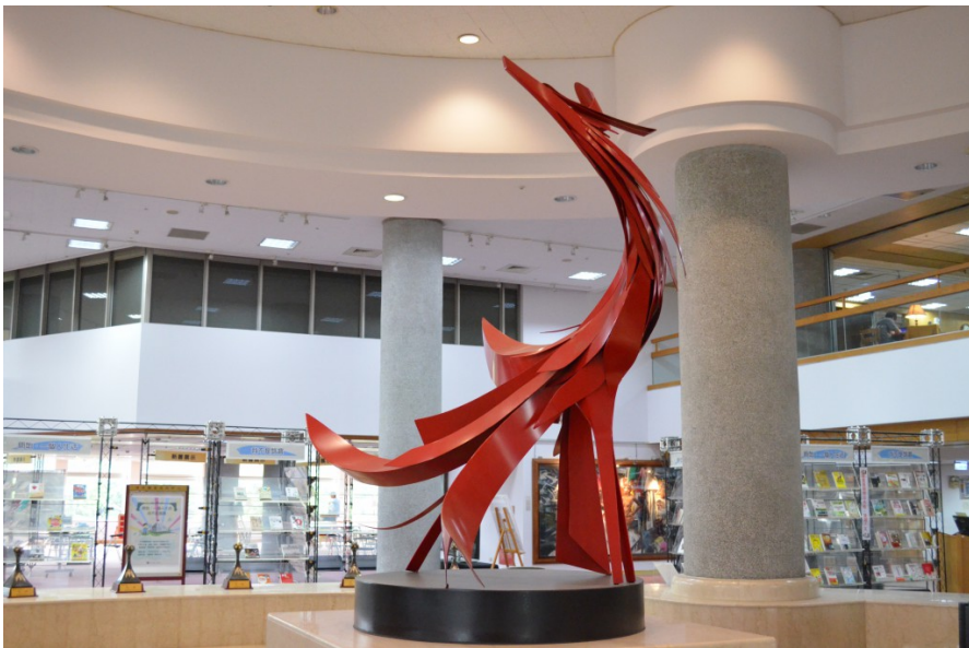
〈鳳凰來儀〉為日本大阪萬國博覽會中華民國館設計。