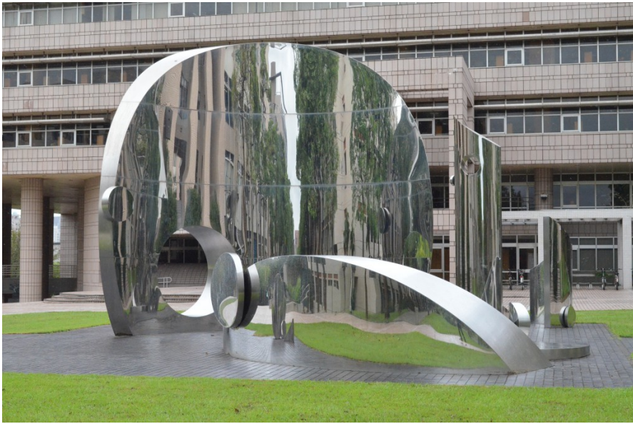
〈緣慧潤生〉以不鏽鋼群組雕塑描繪宇宙的智慧，從不同的角度觀看會有不同的領悟。