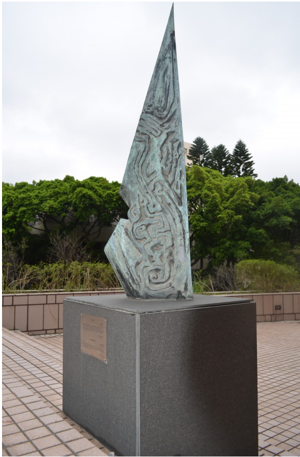
〈夢之塔〉特殊的造型，搭配纖細的雕刻，讓人好奇， 如果現實生活中真有此建築會是怎樣的的存在。