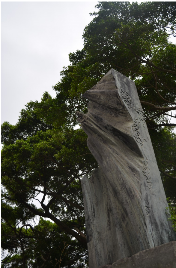
〈正氣〉以「正氣磅礴凜然」形容台灣山脈拔地而起的樣貌。