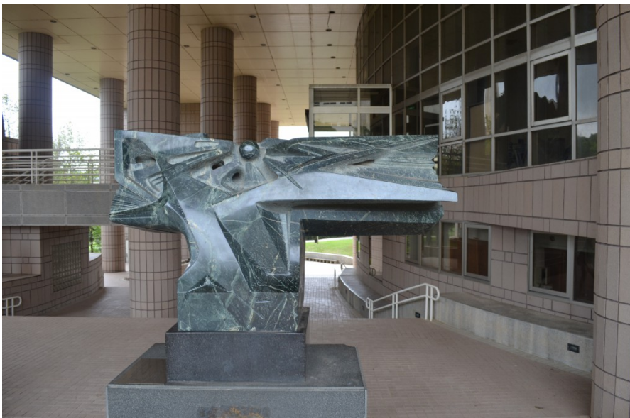
〈南山晨曦〉運用大理石詮釋穿透森林的日光，打破一般人對於晨曦的清新印象。