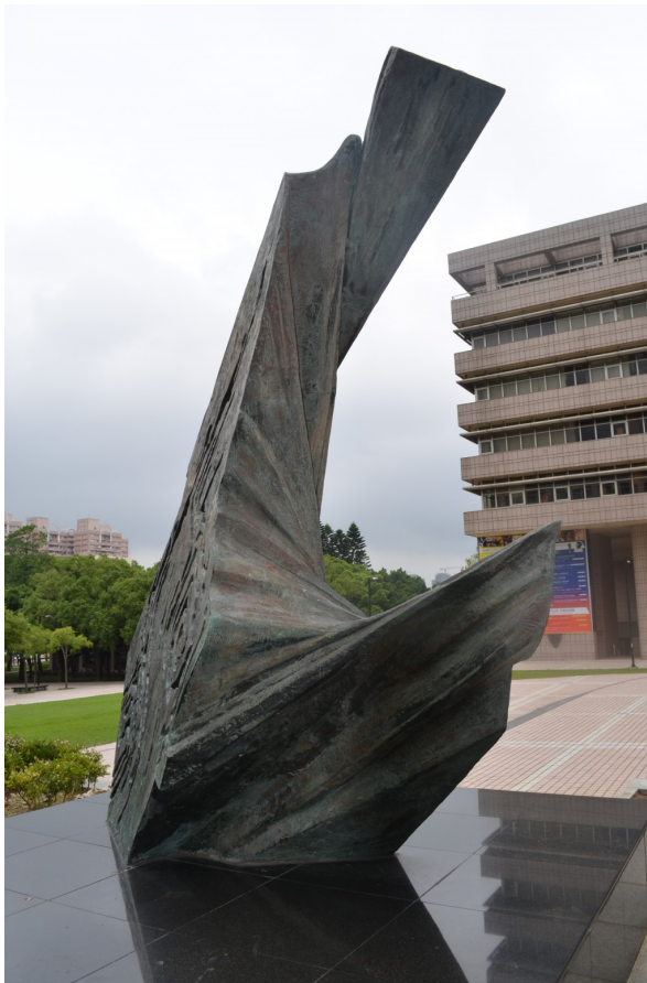
〈水袖〉放射性的線條，將壯麗的山水與飄逸的水袖完美結合。