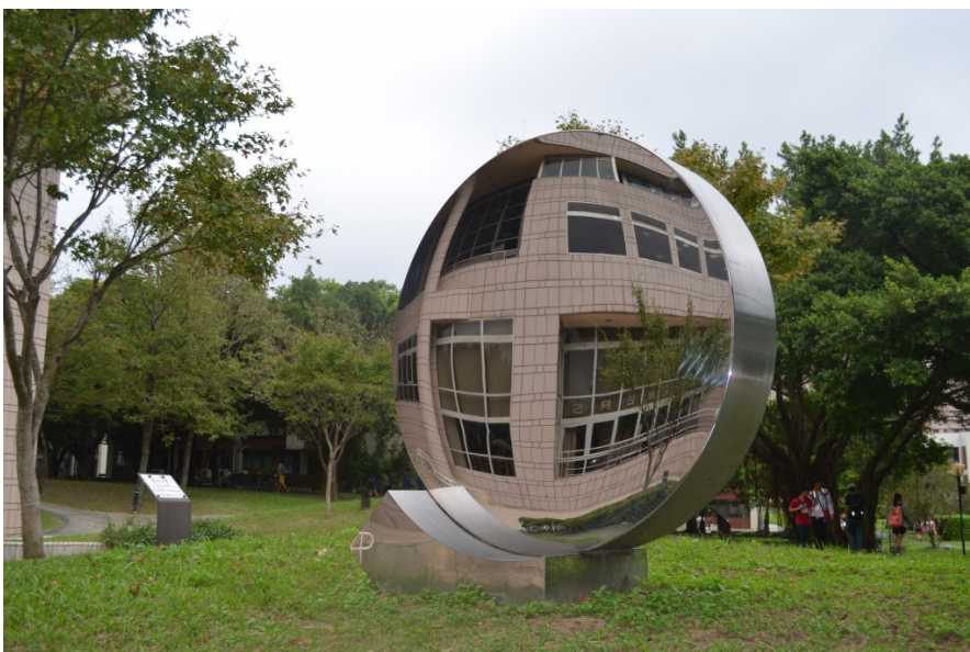
〈月明〉從古至今，皎潔明淨的滿月，總令相隔異地的親友觸景興嘆，「但願人長久，千里共嬋娟。」