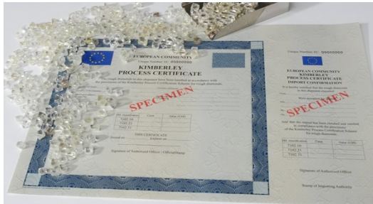
「金伯利流程認證機制」的證書。

為制止這樣的衝突鑽石流入市場，二〇〇二年，聯合國與幾家規模大的鑽石貿易商及一些非政府組織一同擬了「金伯利流程認證機制」(Kimberley Process Certification Scheme, KPCS)，目前共有七十七個會員國加入，台灣也是其中一員。有這一張證書的鑽石，代表著它未受血染的純淨，一顆顆流入市場，套在人們的手中。聯合國估計，相較於二〇〇三年全球有百分之二十五的鑽石來自非法交易，現在已降至百分之五到百分之十。