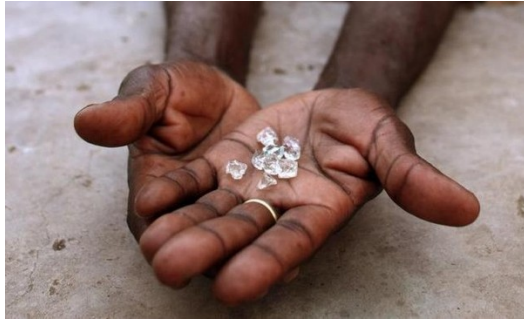
這些鑽石誕生於血汗與戰爭中。