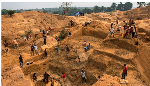
礦工們從早到晚幾乎不休息。

為保護這些礦場，礦場的擁所有者通常自備武器或軍隊，有的甚至雇用他國的傭兵或是聘請保安公司，這使得當地的戰局更加複雜。