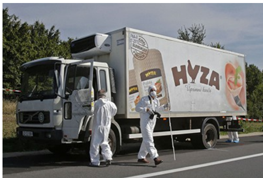
奧地利警方在貨車中發現超過五十具難民屍體，因為車中無通風設備而被悶死，其中包含多名孩童。

在《被遺忘的亞洲碎片：那一段不為人知的底層故事》一書中的故事，都是中亞以及東亞的報導，但在西亞，極權以及戰爭所衍生出來的問題，也正在上演著。敘利亞被二〇一一年「阿拉伯之春」所激勵後，發動遊行要求民主改革，人民不滿政府的極權統治，最後卻演變成長年的內戰，許多敘利亞人淪落為難民，底層的人民開始流浪，或是選擇偷渡到其他鄰近國家，形成「歐洲難民潮」。他們天真地懷抱著歐洲夢，希望在新的國度可以有嶄新的生活，但是歷史警惕著，這最終可能只是一場空。