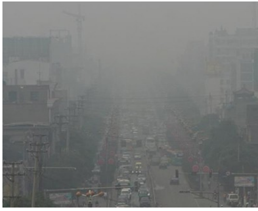
中國臨汾市由於煤礦產業發展，空氣汙染相當嚴重。