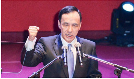
臨全會通過柱下朱上。