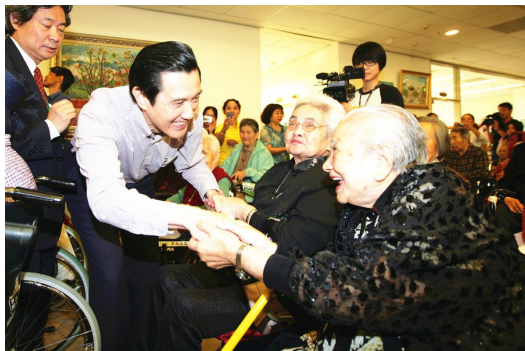
老人安養問題一直是台灣社會關注的議題

灣尤其重要。時常可以在新聞報導中見到有不少的獨居老人發生意外，而這些獨居老人大部分都是因為子女旅居在外地，又對於父母的責任心不夠重，只是把每個月的生活費寄給父母，平時也不打電話或回家關心父母，最後導致獨居老人們容易發生意外。