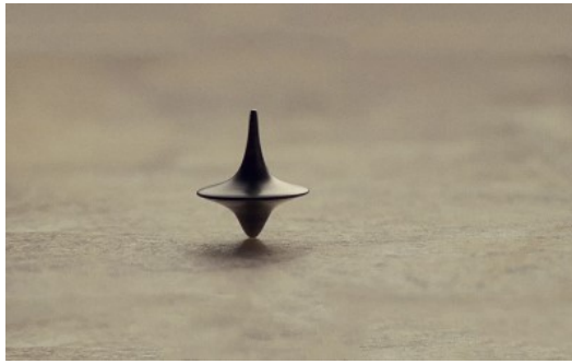
電影【全面啟動】（Inception）也大玩夢境的可能性。

性被融入在許多作品中，形成了「夢」的創作市場。像是電影【全面啟動】（Inception）就以「侵入夢境」的形式，去改變人的思考，其主觀進入他人夢境的角度，與此書不謀而合。雖然其中仍存在差距，但對於夢的自由詮釋，正是這些作家發揮想像的最佳場域。本書中無處不在的夢境場面，還有預知夢的拼湊，搭配上連貫錯綜的故事，為《殺手》系列寫下了嶄新的一頁。