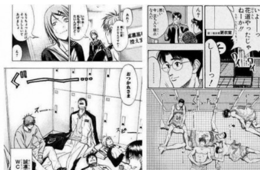
《影子籃球員》與《灌籃高手》兩部作品時常被拿來做比較。

雖然《影子籃球員》也有加入讓球員們越來越強的劇情，但球員原本的能力就已經超乎常理，就算能力變得更加強大，對於讀者們來說，並不會感同身受。