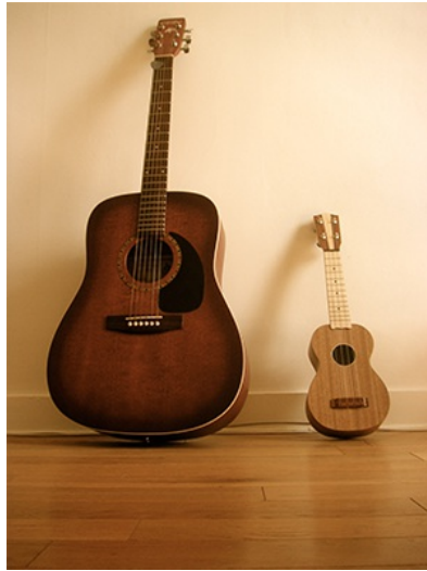
吉他與烏克麗麗，好比大陸與台灣微妙的關係。

台灣和大陸的兩岸關係像是烏克麗麗和吉他，很多人並不了解兩者的區別，同屬撥弦樂器家族如同兩岸屬同文同種，但是看似外型相似的兩者，在構造、材質以及音色上卻是完完全全地不同，就像兩岸的生活習慣、教育制度、社會價值觀等存在差異。儘管烏克麗麗也被稱為小吉他，但它不會甘願以尺寸大小來定義它的地位，不過要是兩者能協力合作，吉他的沉穩大器與烏克麗麗的靈活輕巧相輔相成，就能譜出最動人的樂章。