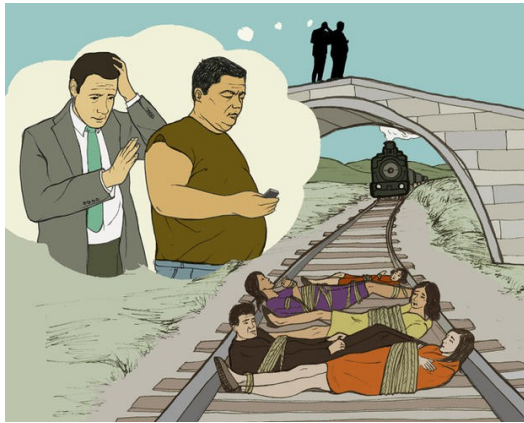
天橋情境中，由於將他人推落軌道的行為過度違反道德良知，即便能拯救更多人，多數人還是不願為之。

經過作者以哲學辯證的方式，發現每個人在世上所追求的共同目標——快樂。每個人都希望在不過度違反道德的情況下，讓世上的快樂總值達到最大。從心理學的角度闡釋，每個人在進行決策時，會以實效主義式的觀點進行思考。然而，若是行為本身雖有助於更大的善，但同時也違反了人的道德良知，便有可能阻止其行為的發生。這種腦中「理性」與「道德」間的抗衡作用，作者稱之為「雙重程序」原則。