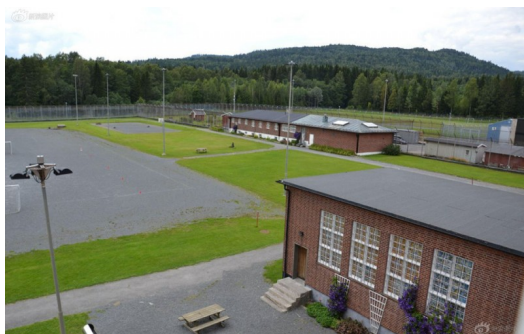
位於挪威首都郊區的哈爾登監獄，有世界最人道監獄的名號。

台灣目前的民意顯示，大多數人依舊認同死刑的存在，原因可能在於廢除死刑過度違反臺灣民眾的道德情感，無法擺脫既有的道德包袱。某些積極的實效主義者可能會主張動用國家預算，建立一個美好而獨立的環境，將重刑犯永遠隔絕於其處。而公平正義的分子可能會因此忿忿不平，認為惡徒不應如此享受國家公帑，無疑是變相地剝奪善人的資源。