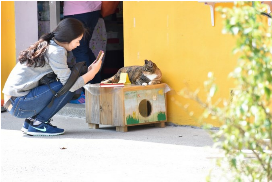
大部分的遊客都會搶著拍貓咪。