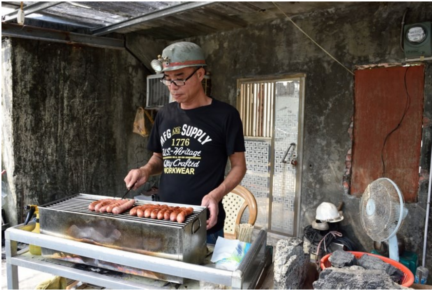
在地的居民有時候會以礦工為主題販賣食物。