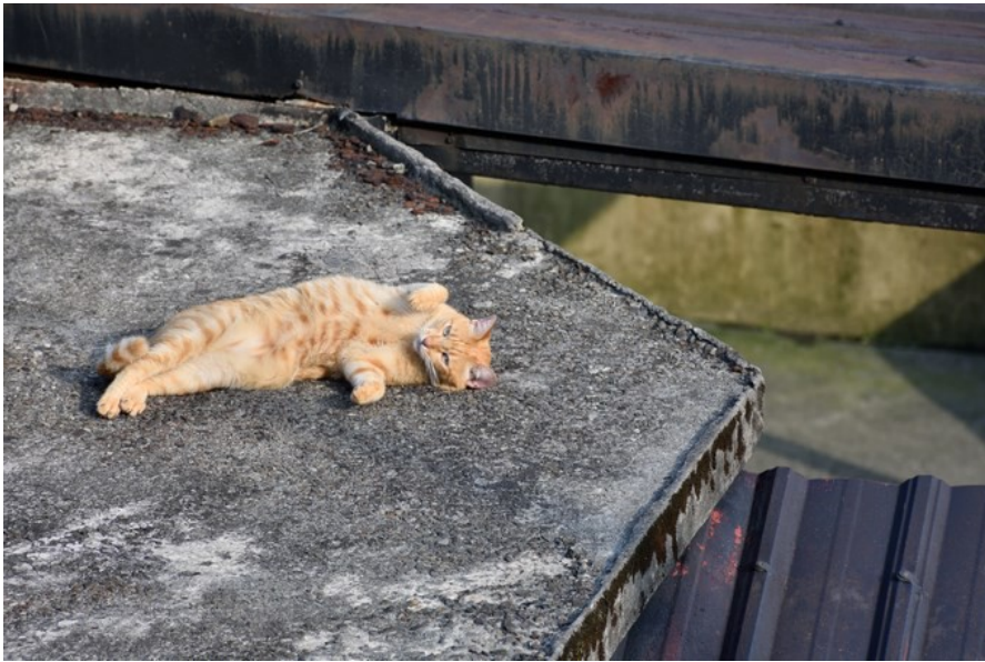
在屋頂也可以發現貓的蹤影。