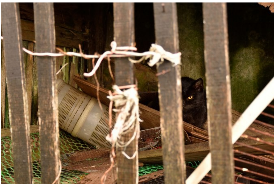
雖然大部分的貓都不怕人，但也是有例外的。