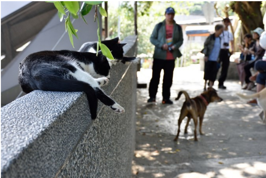
只要不被冒犯，猴硛的貓不會主動攻擊其他人或動物。