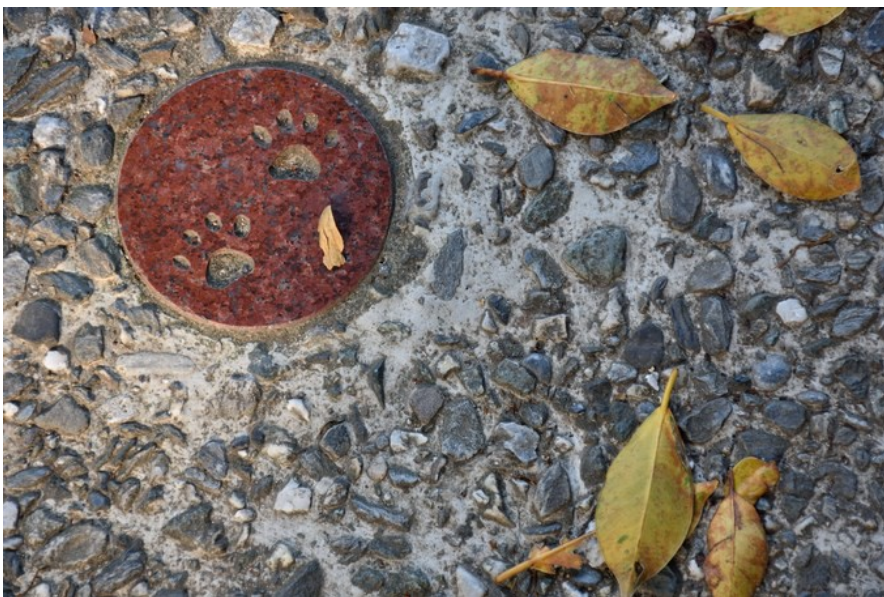
連地上都充滿著貓的特色。