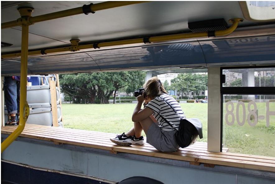
改造後的公車搖身一變，讓民眾能在各個角落享受難得的個人時光。