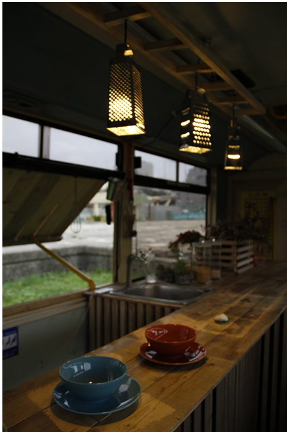
保留些許公車的 original，利用回收木作為材料，將城市田園號公車內部改造成公共廚房，也傳達「自己的廚房自己造」的新概念。