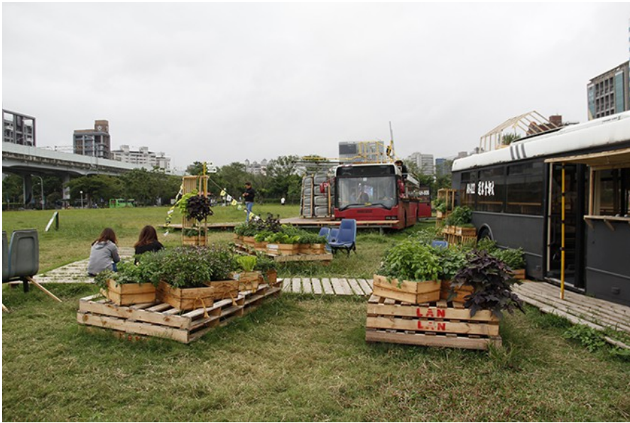
在周圍大樓環繞包圍下，曾經穿梭都市中的公車更加顯眼，成為專屬市民的小天地。