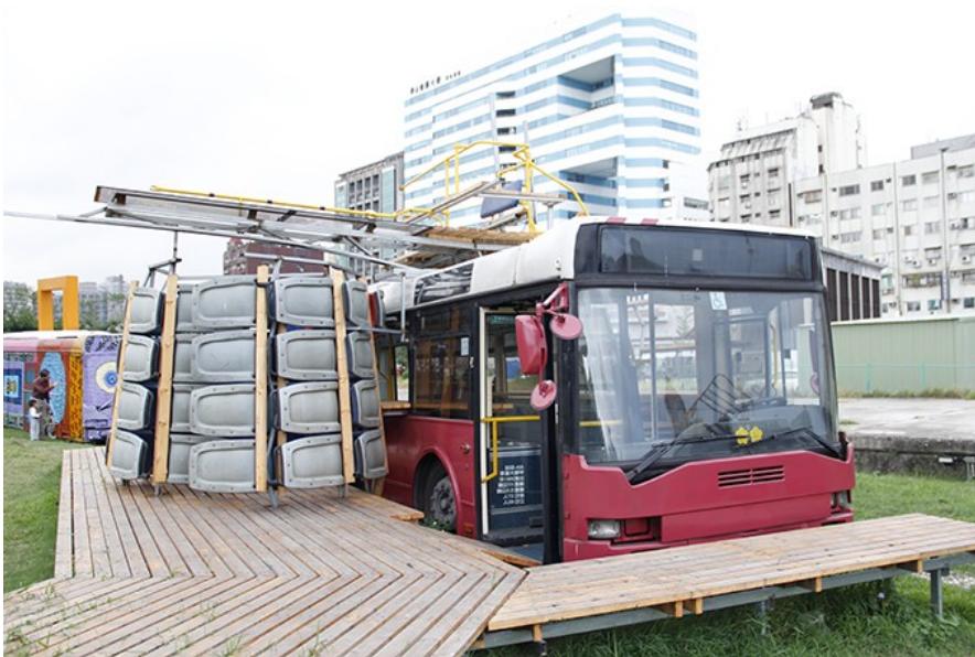
作品「作動轉置機」將公車原有的樣貌重新排列，轉變大眾過去體驗都市的方式。