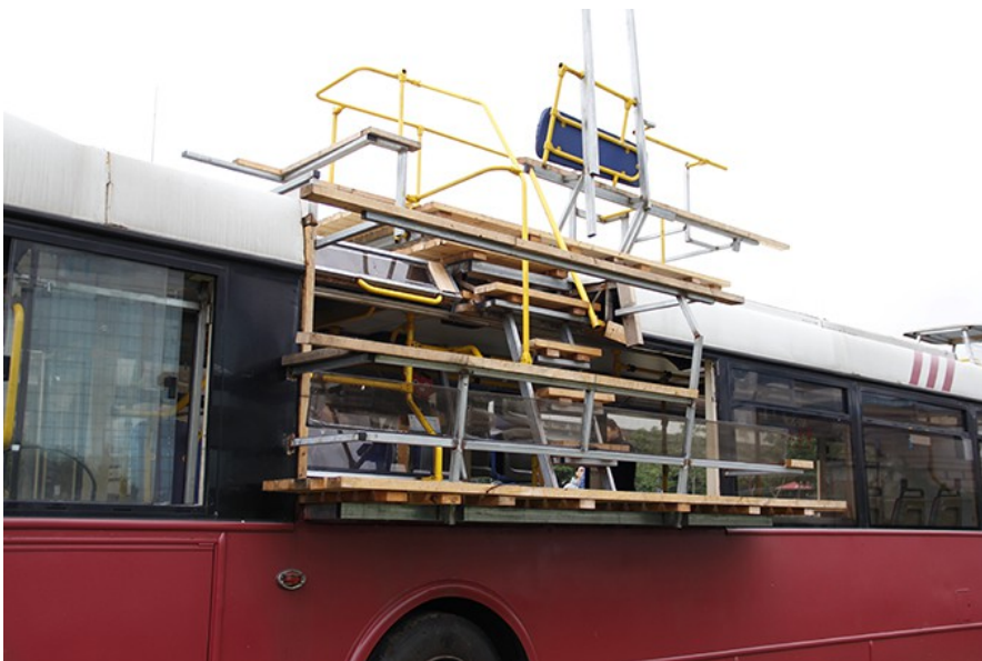
作動轉置機開放民眾爬上階梯，站上車頂，實際感受空間的翻轉。