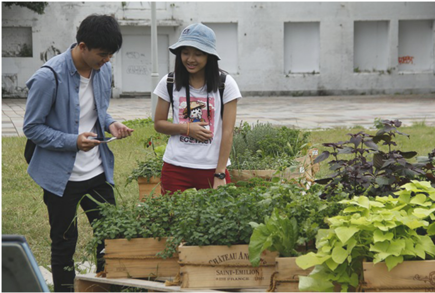
藝術家同時結合可食地景與都市農園，將植物種植在公車外，使民眾可以更親近食材。