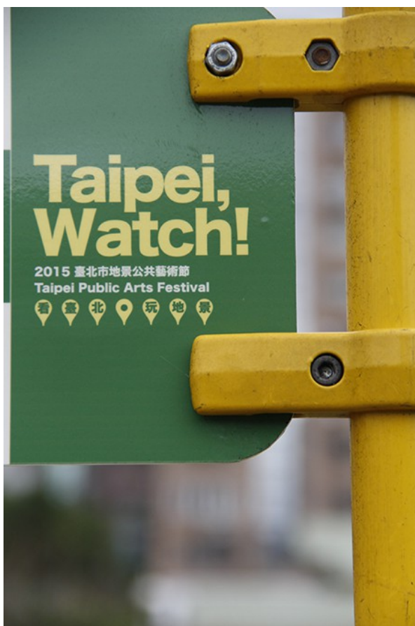
「Taipei, Watch!」，象徵將市民日常生活中未發掘的事物賦予新面貌，讓城市中的每物每景走入人民生活。

三組藝術家結合公共藝術理念，為老舊的公車換上新衣。相較過去人文設施被動等候大眾接近，這次活動突破框架，讓城市中的文化設施主動走向市民，同時串聯過去與未來，賦予臺北市嶄新的動力，並且提醒市民再次「Watch」生活中早已被遺忘的美好。