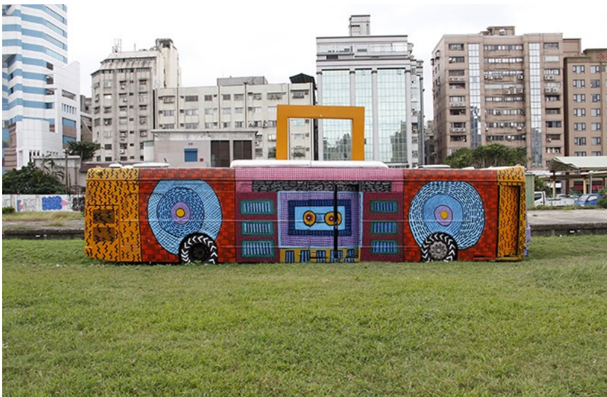
象徵街頭嘻哈與塗鴉藝術的大型手提音響（Boombox），體現臺北街頭文化與市民生活融合為一的精神