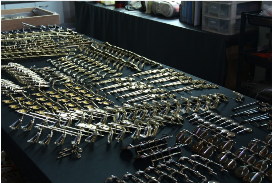
薩克斯風管的細小部件數量高達上百，需要龐大的產業鏈配合，而如何將部件全部組裝起來，更是一門大學問。