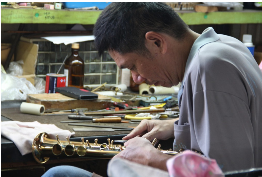
后里大多的薩克斯風管工作坊為學徒制，很多工匠從國小就投入製作產業，薩克斯風管伴隨了他們大半的人生。