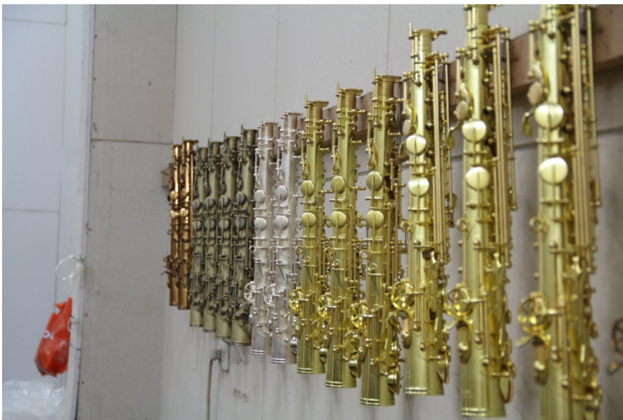
掛在牆壁一隅上的薩克斯風管，材質的差異並非只影響外觀，更影響音色，黃銅音色溫柔，紅銅音色渾厚，白銀音色堅實而亮麗。