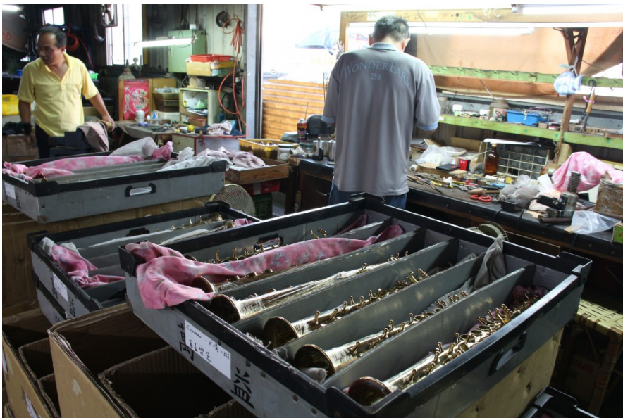
步入工作坊，光線昏暗，薩克斯風管的部件堆疊在各處，這是很多后里的小型樂器工作坊的環境寫照。