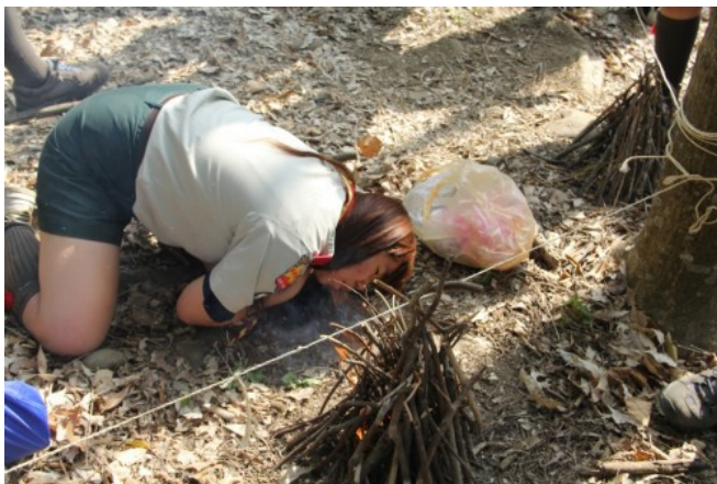
生火為童軍考驗中的一個項目。

在所有的露營活動中，我最難忘的是長達五天四夜音比沙訓練營。其中，又以生火考驗最令我印象深刻，考驗前我們要尋找木材，並獨自用手斧將木材劈成細材，而木材可分為乾柴跟剛脫落且水分較多的生柴。由於我所選生柴多於乾柴，導致剛開始火並生不起來，且在只能使用五根火柴來起火的限制下，我一度想放棄考驗。幸好，在夥伴的不斷鼓勵下，我重拾信心繼續尋找幹柴，並透過拼命朝火源吹氣，順利生起火、燒斷棉線通過了考驗。