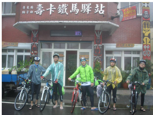
既使風雨再大，我們仍然登上壽卡。

發，有的因為天冷環抱在一起取暖，有的往回路走去幫忙跛腳的夥伴，此刻可謂患難見真情。