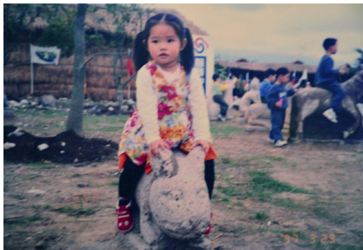
小時候皮膚較白，並沒有像此刻一樣黝黑。

還記得幼時的我皮膚並沒有像此刻一樣黑，對於「一白遮三醜」更是沒有什麼概念。我只知道做自己喜歡做的事是很幸福的，因此國小下課時不管太陽有多麼炙熱我仍會和朋友到操場玩耍，假日則會和爸媽騎腳踏車到附近的田裡嬉戲，追逐溪流中用竹葉做的小船，將大自然的一年四季盡收眼底。