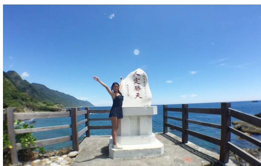
既使人生困難重重，也要勇於做自己。

或許是審美觀的不同，在每段曬黑的歷程後，都會有人驚訝地說：「你怎麼敢曬黑啊！」或是無法理解我的舉止。起初，我聽到這些話時，會懷疑自己是否不應該為了做這些事，而讓自己曬得如此黑。但是每段歷程回想起來都快樂且刻骨銘心，在童軍時，我學到了許多平常生活中學不到的技能；在環島，我學會為自己的人生勇敢，並見證了友情最珍貴的一面。