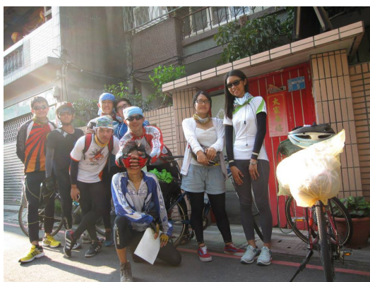
環島倒數第二天在朋友親戚家前的合照。

在為期十三天的旅程中，我們印證了「臺灣最美的風景是人」這句話，路上許多民眾都會熱情地為我們加油，有時只是簡單比個讚，有時卻是搖下車窗大聲為我們吶喊。在汗水直流幾近崩潰的邊緣，他們的一舉一動都如春風般帶走內心中混亂情緒。