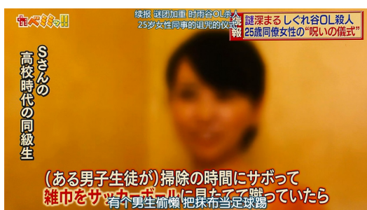
巧妙地將電影畫面轉換為新聞畫面，加上字條，打上馬賽克，加深臨場感。

透過畫面切換，也將媒體斷章取義的陋習完整呈現。劇中嫌疑犯城野美姬的父母，在接受記者採訪時，表示相信女兒並非殺人兇手，也替謠言造成社會的恐慌，禮貌性地道歉，但新聞台透過剪輯手法，只留下父母親向大眾道歉的片段，暗指城野美姬的雙親默認女兒殺了人。劇中新聞台最後所播報的內容，與案件相關人的口供有極大的出入，一、兩句話的差異，導致全然不同的結局。資訊發達的年代，取得消息的管道多且便利，也因此人們時常忽略了求證的重要性，不過濾新聞的真實與否，作者對現今媒體亂象、社會風氣的諷刺，透過劇情的設計表露無遺。