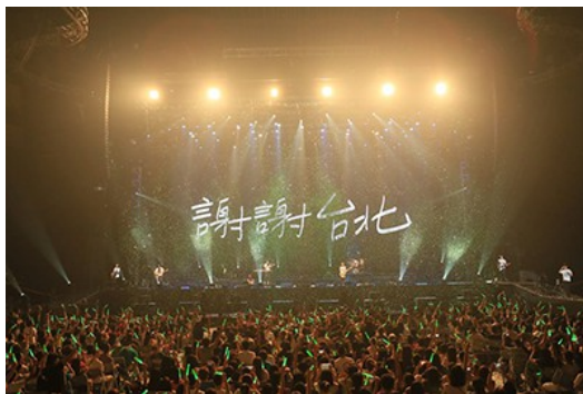
蘇打綠的名氣日漸高漲，演唱會幾乎場場爆滿。