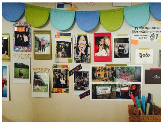
女孩一直很珍惜在身邊的每一位朋友，將記憶貼在牆上，看到時心總是暖烘烘的。

也因為這些安穩的存在，女孩開始明白做自己其實只是嚇跑了不適合自己的那些人，然後將最真誠相待、真心的人留下。