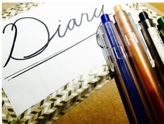
因為國中的遭遇，讓女孩對「日記」產生排斥。

中。日記裡除了繁瑣的事之外，還有一些對她的惡意言論，女孩雖然知情卻從沒有勇氣提及。國中的扉頁，她從沒想要刻意回頭翻閱，但至今那段記憶仍能無預警地霸佔她所有思緒。整顆揪緊的心，無法細數所有原因，潸潸然淚如雨下。