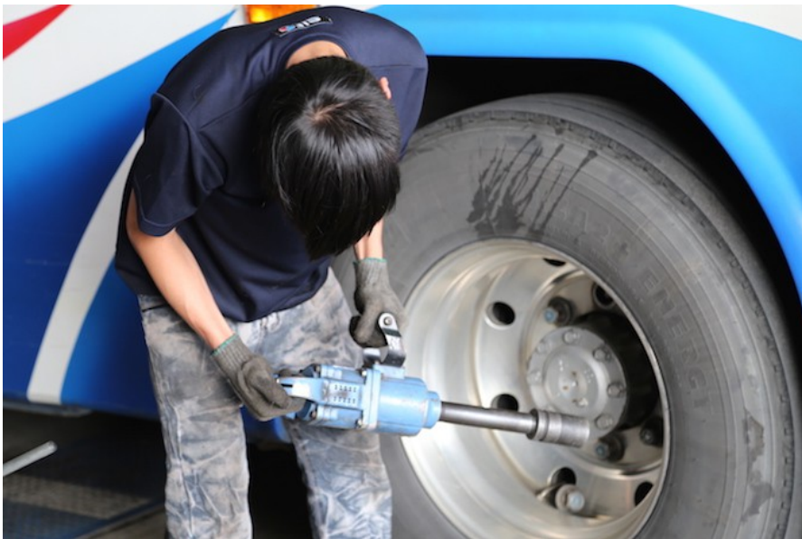
麥哥是輪胎定位的學徒，遊覽車、貨車是主要客群。 為了平穩地架上電腦，以求精準數據，拆螺絲是首要步驟。