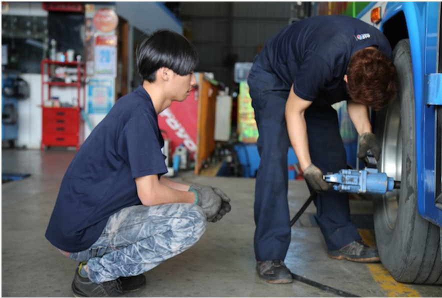
夔哥雖然年紀輕，但資歷較深，即使同廠的學徒年紀長，他也會不時在旁指導，儼然成為小師傅。