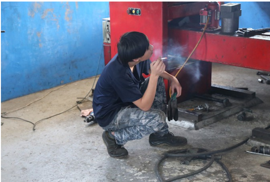
忙裡偷閒抽根煙，但身影仍離不開工作，何曾鬆懈？