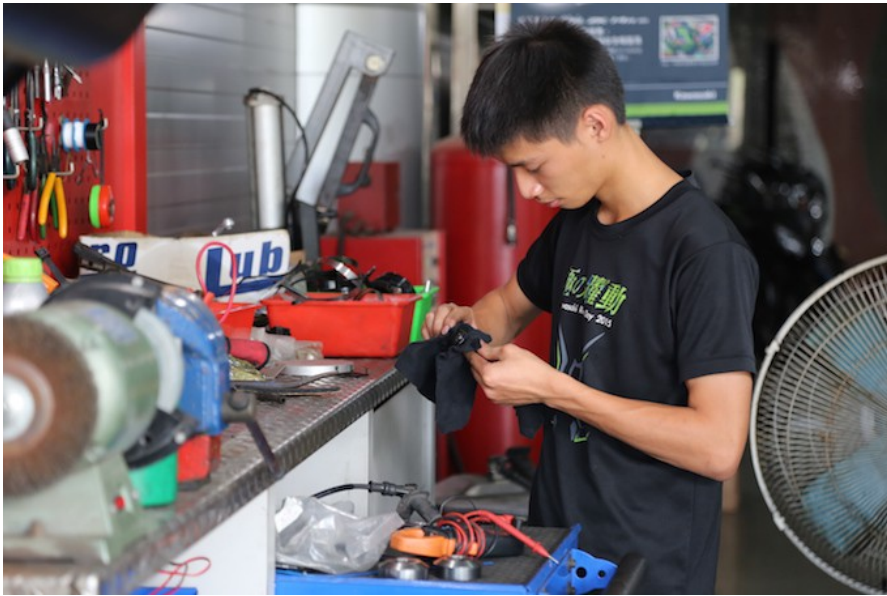
除了工具的使用，也需注意其基本清潔，以便讓下個使用者好操作。