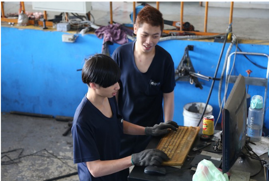
從事輪胎定位可謂智武雙全，不僅是體力的挑戰，技術層面也不容懈怠。 他們需使用電腦觀測底盤角度的數據，並根據經驗將其調整至最準確的角度。