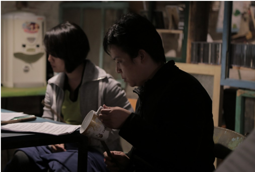
一旁未參與打擊的團員也拿起手邊杯子，隨著節奏敲打，隨興卻不顯得突兀。