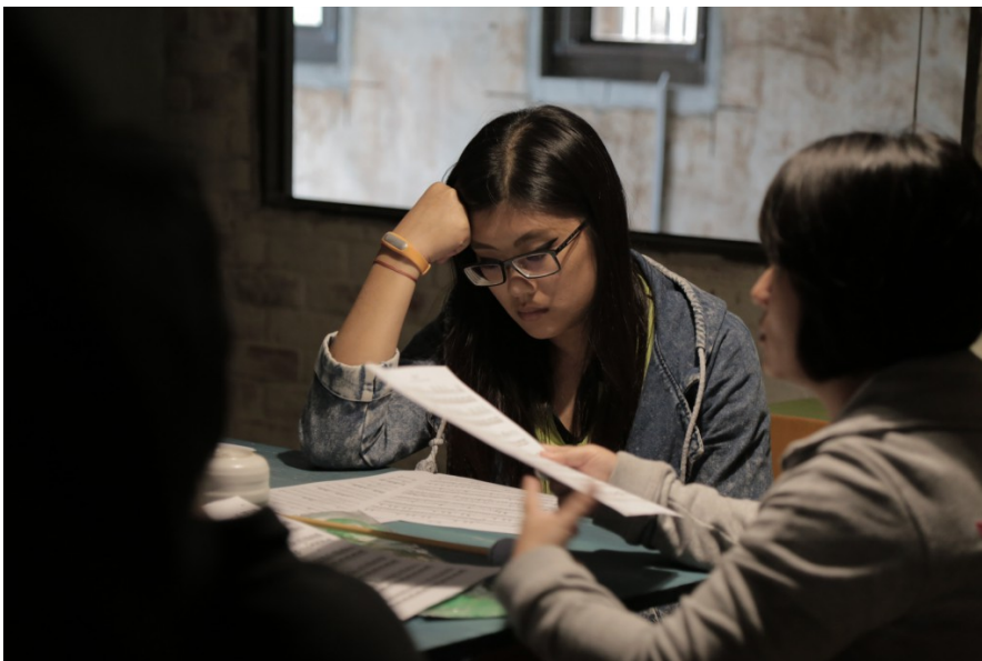
雖然並不是所有團員參與此次練習，未參與的團員依舊低頭研究著鼓譜，在旁為曲目提供更好的建議。