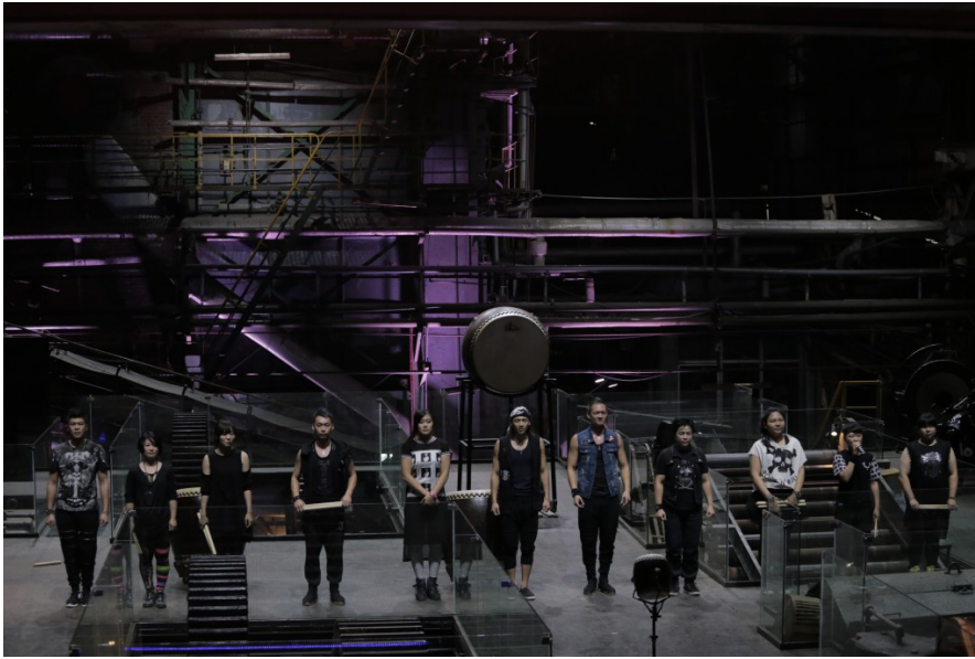
演出結束後，團員們一字排開，向觀眾致謝，並邀請觀眾繼續支持台灣鼓樂。