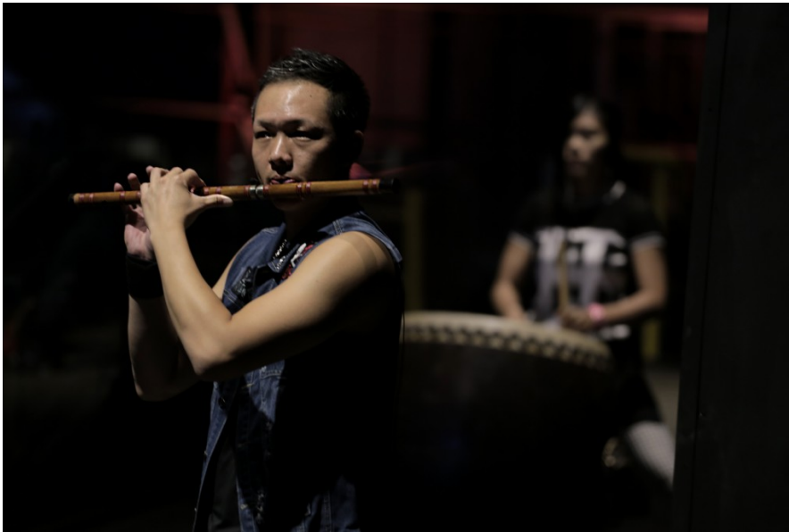
除了傳統鼓樂，演出也加入笛子，為樂曲增加了豐富度。