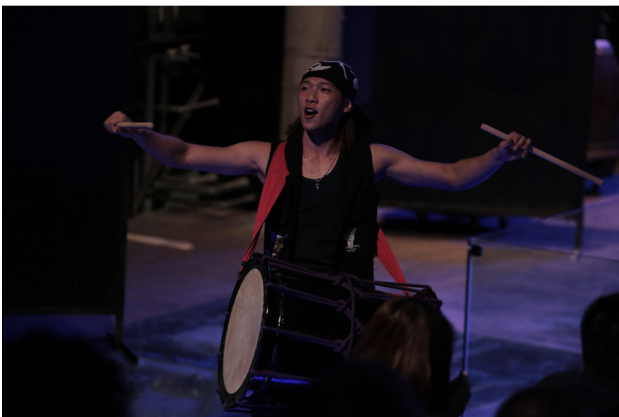
表演時，團員們也會來到舞台前與觀眾互動，以打擊鼓棒示意觀眾隨著節奏拍手，一同加入演出。