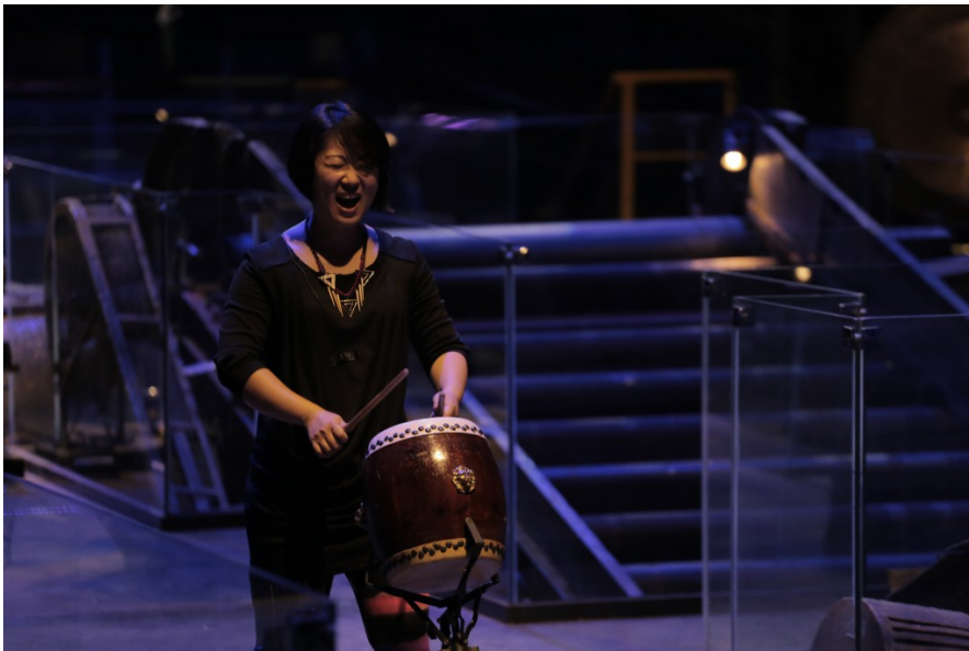
團員們在打擊時也會一同吶喊，配合著激昂的鼓聲，聽起來振奮人心。