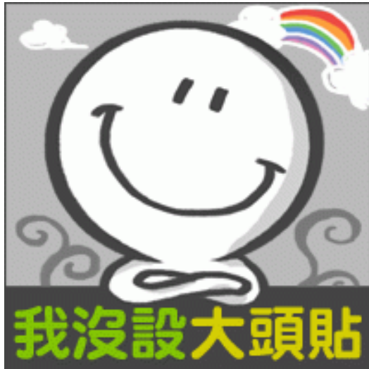
頭貼是網路使用者辨識身分的方式。

隨著網路的使用越來越普及，接觸人群的方式也跟著改變，逐漸被網路社群取而代之，甚至在網路上的一舉一動，也透露出使用者的立場和思想。在知名網路社群臉書（Facebook）中，使用者高達十四億人，其中的一項功能——頭貼，更是用以代表每位使用者的重要表徵。