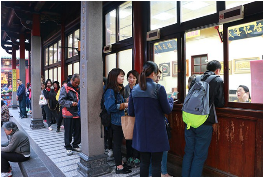
許多前來求籤的民眾正在排隊等待解籤。