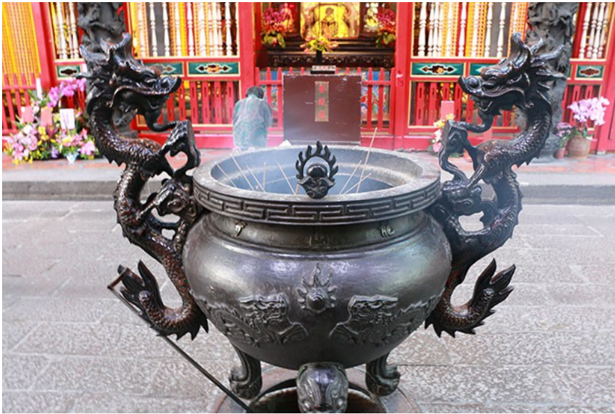
信眾參拜時須在各個香爐點香，現今為因應環保，在向觀世音菩薩擲筊請示香爐從以前的七爐變成現在的三爐，既保留傳統文化又保護地球環境。