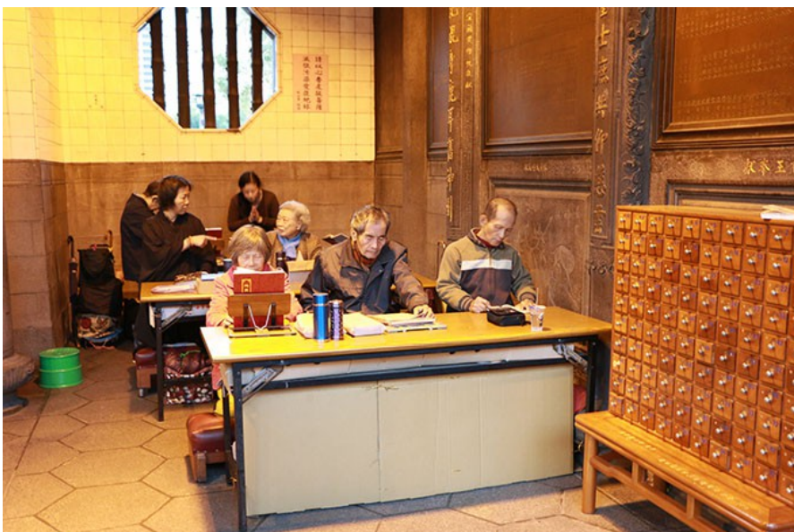
信眾正在專心地研讀經文。