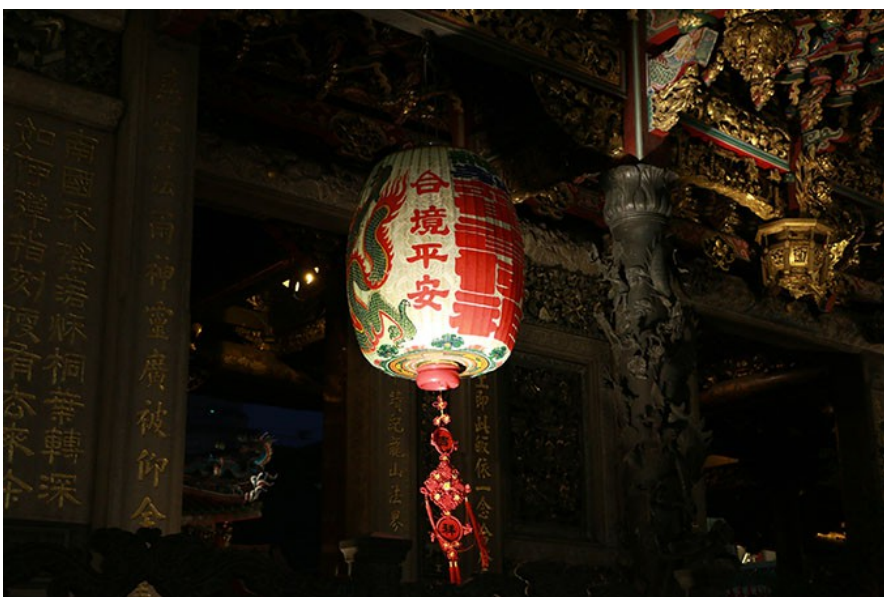
位於三川殿旁的大燈籠，保佑人們風調雨順、一切都平安。