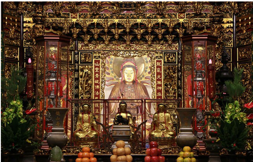
四大菩薩之一的觀世音菩薩。