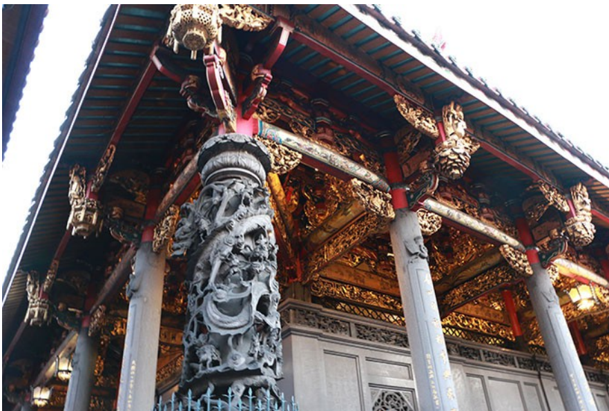
精美的建築雕工是龍山寺的一大特色，可以顯見當時工匠師傅手藝的精巧。