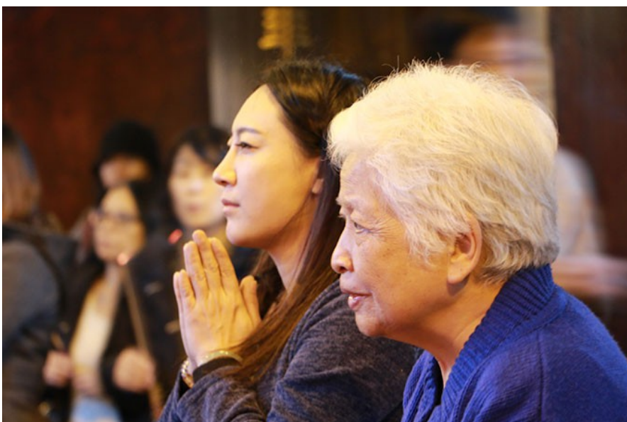
信眾虔誠地祈禱。