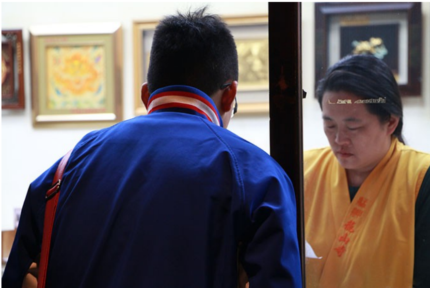
解籤人員細心地向民眾解釋籤的意思。