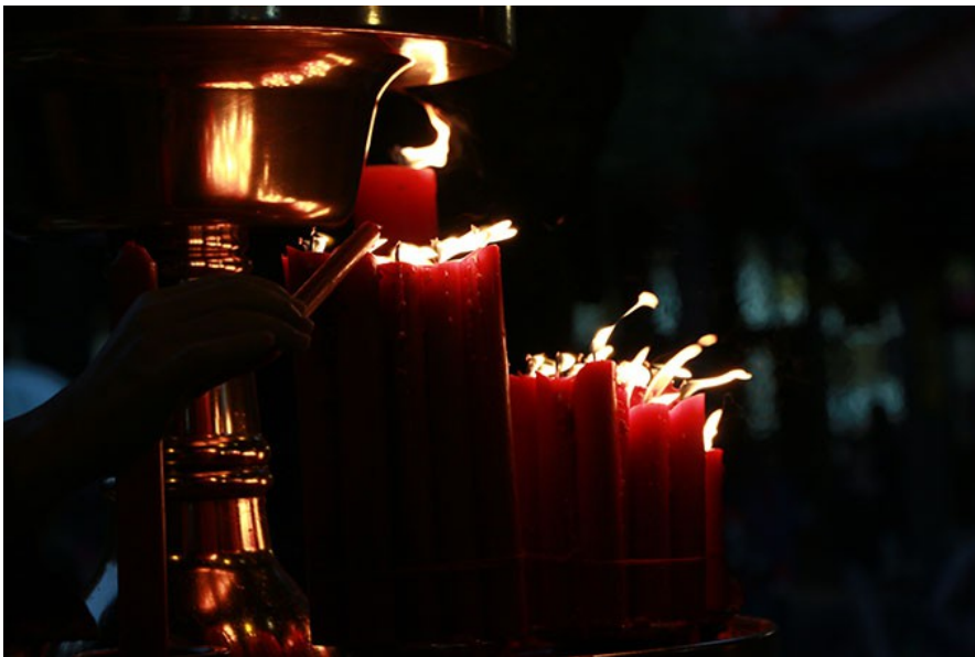
民眾點燃手中的蠟燭，祈求神明保佑自己與重要的人能夠前途光明。