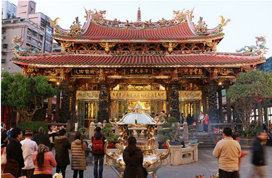
艋舺龍山寺每天吸引無數的民眾和觀光客前來參觀，人潮絡繹不絕。

艋舺龍山寺歷史悠久，從清朝到現在經歷過大地震、颱風和第二次世界大戰等無數的考驗，在許多有志之士和師傅們的幫助下，數度毀損後又重建，這座宏偉又美麗的寺廟才能屹立不搖至今，目前為國家的二級古蹟。每天吸引眾多民眾前往參拜、上香之外，同時也是外國觀光客來台必經的旅遊勝地。