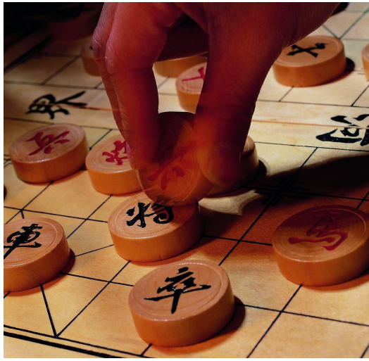
老人誇耀著自己青年時的風光，晚年後卻孤獨一人， 使得自己的長篇大論有如紙上談兵。