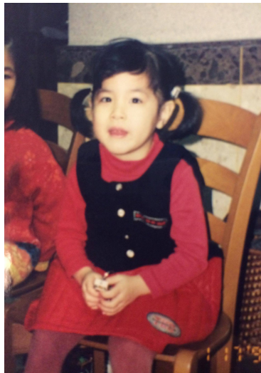
小時候的我，喜歡綁著雙馬尾。

身為家裡的老么，小時候我被當作掌上明珠照顧著，假日和家人去公園玩，總是穿著粉紅色的蓬蓬裙，綁著雙馬尾，腳上踩著繡有蕾絲的娃娃鞋，過著備受寵愛的童年生活。家庭所給予的環境，讓我認為自己長大後，一定會成為很棒的女孩，品學兼優、知書達禮，過著與長輩們一樣順遂的人生。但是沒想到這些對未來的期許，在七歲開始上小學後，竟然變成一種遙不可及的夢想。