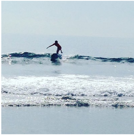
馳騁於浪花間。

清晨，當觀光客還在與床纏綿時，是換宿生可以盡情享受整片海洋的大好時機。外海矗立著龜山島，偶爾我們能從島上看見太陽露出曙光，非常浪漫。要如何平穩的站在衝浪板上不掉進水裡實是初學衝浪的人會遇到的難關，什麼時候會有大浪，什麼時候適合上衝浪板，海洋未知的力量是無法預測的。學習衝浪最快的方法，就是去找在「搖滾區」的專業衝浪客教學，我認識了一名叫做「章魚哥」的衝浪好手，他鼓勵我去較深、浪花較大的水域，並告訴我站起來時，一定要看著眼前的山頭，絕對不可以看自己的浪板，否則就會失了重心。當我遵照他的指示後，我居然成功地駕馭了一道高我一倍的大浪，並且在浪上馳騁了好一陣子。我想這就是衝浪最迷人的時刻，在最愛的海洋中，隨著浪花與它並行前進，就好像走在海上的舞者般輕盈自在。於是，奔向海洋成為我每天必行的功課。