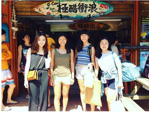
換宿間結識來自各地的好友。

換宿期間，我結識多名來自台灣各地的友好，每個人來換宿的理由都不盡相同。有人想忘記一些難過的往事、有人想趁當兵前享受自由的片刻、也有人是剛好環島到這裡便決定佇足休息。不同的原因，卻朝著同樣的方向前進，我們都是為了「尋找自己」而來到宜蘭，然後相遇。