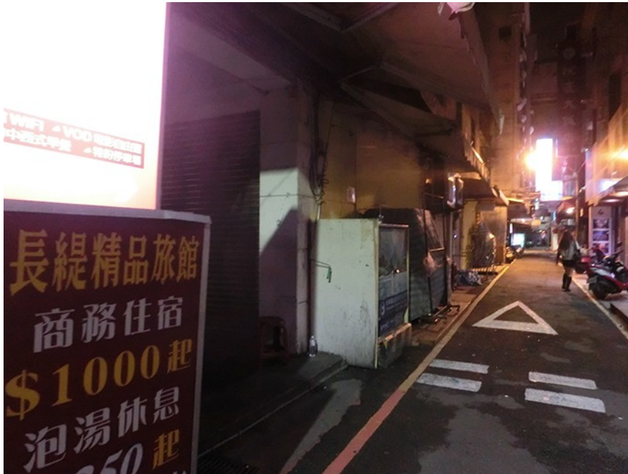
市區的街道，在入了夜以後，有不同於白天的工作形式。

政府執行掃黃活動之餘，原本棲身在茶坊、按摩院的特種行業女子，被迫走出避風避雨的屋簷，拋棄僅有的尊嚴，在大街上兜售自己的肉體；沒有謀生能力的她們，別無選擇地用這種方式，在都市的夾縫中求生存。年華老去的流鶯們，在暗夜的街頭，找尋人生的十字路口。