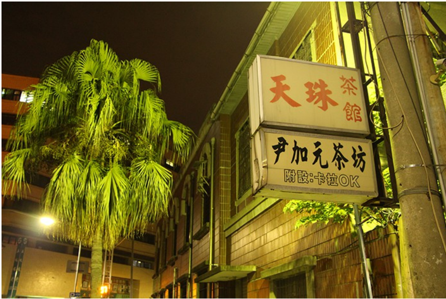
隱藏在巷弄間的毫不起眼的招牌，只有熟客才知道入口。