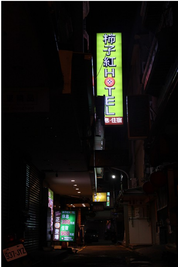
入夜的新竹，只有旅館的燈還是亮的。