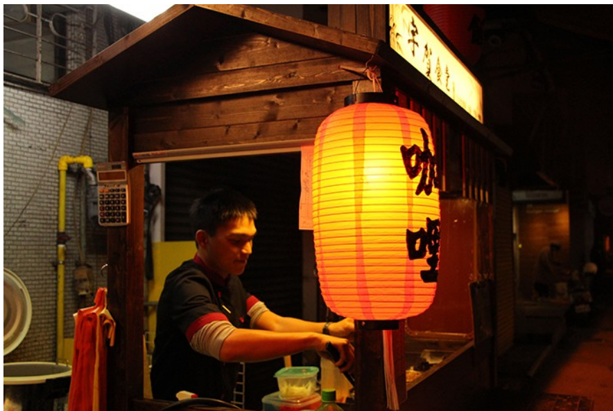
周邊小販都深知流鶯的存在，並不會去干涉她們的生存模式。