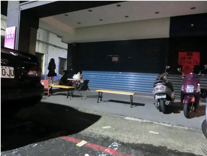
從事特種行業到了一定的年紀，就是別無選擇的悲哀。