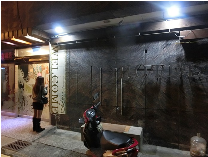
煙花女子對著旅館門口的鏡面補妝。