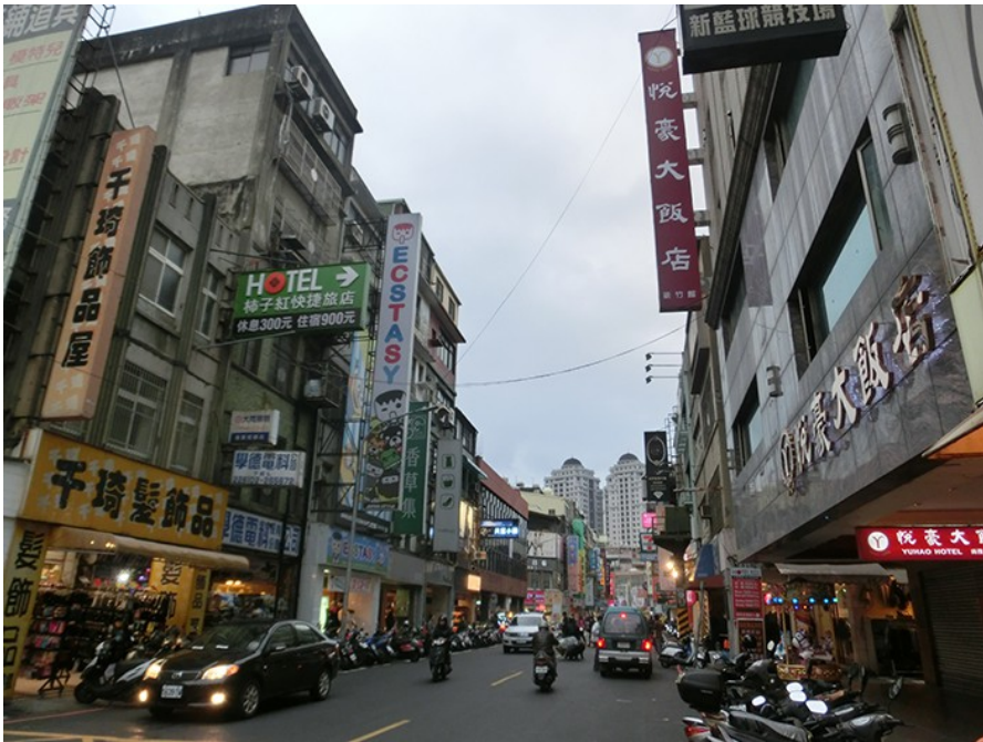
白天的街道車水馬龍，絲毫看不出來夜晚不為人知的一面。