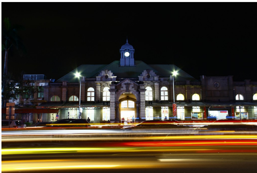
夜半時分的新竹火車站依舊燈火通明，來來往往的車子和旅人為新竹的夜晚帶來熱鬧的氣氛。

熙來攘往的新竹火車站，到了午夜時分還是像白天一樣熱鬧。但在這繁華喧嘩的都市底下，卻住著一群流離失所的人們，過著有一餐沒一餐的日子。街友一直以來都是社會問題之一，但現行政策卻無法給這些流浪街頭的人一個自力更生的機會。