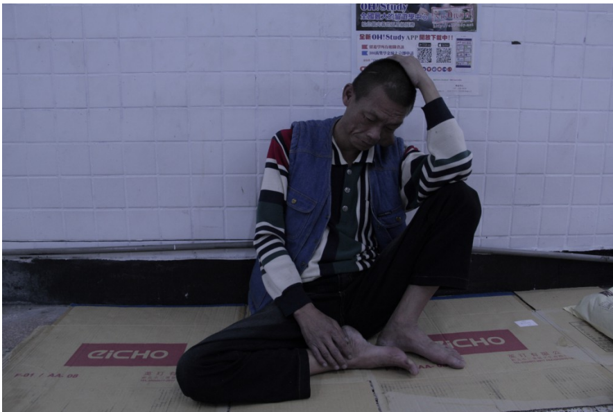
沒有了家人、健康與財富，街友的日子只能過一天算一天，他低頭不語，對未來感到茫然無助。