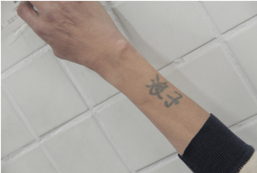
學生時期象徵著叛逆與領袖的刺青，現在看來卻對生活沒有任何的幫助。