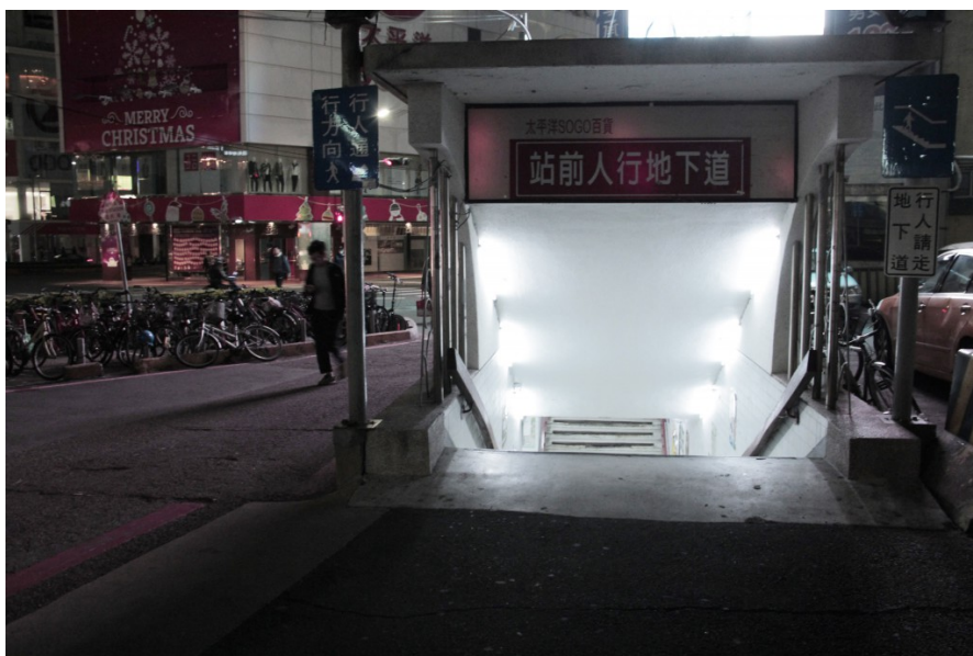
但是火車站前的地下道，卻是通往不同世界的入口。