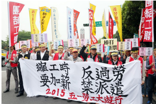
許多勞工參與五一勞工大遊行，希望藉此獲得政府關注，改善勞工權益。

二〇一五年五月一日，勞工團體號召勞工大遊行，提出四大訴求，分別是「縮工時、要加薪、反過勞、禁派遣」，呼籲政府正視勞工的權益。面對經濟不景氣的環境，許多企業在僱用勞工時，開始採用非典型職務的方式，導致非典型就業人口持續增加，也因此這類勞動者的權益逐漸受到重視。