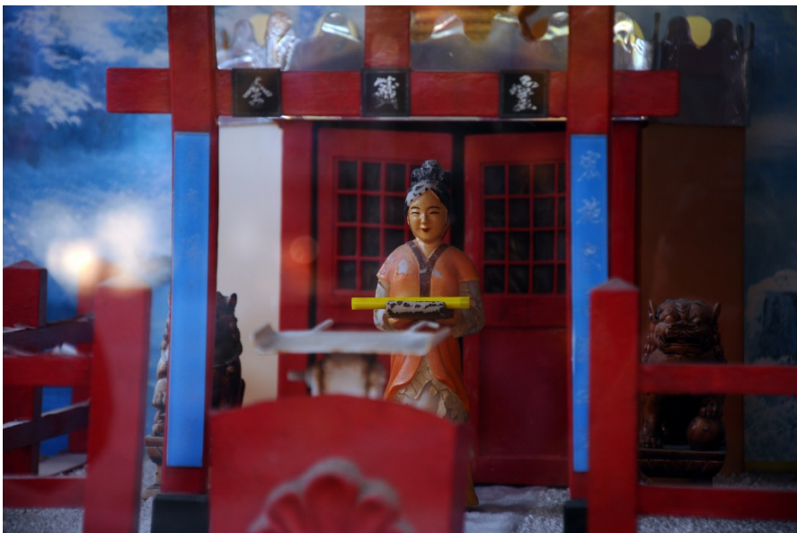
四面佛對面有一個老舊的求籤機，投入十元便會有人偶捧著籤走出靈籤舍。