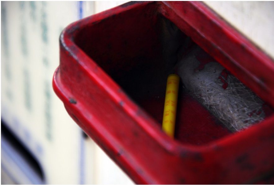
求籤機掉出一支紙籤，機身斑駁，看得出歲月的痕跡。