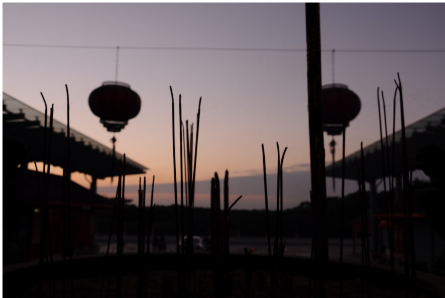
將普天宮走完一圈，太陽也逐漸下山，香爐中的線香持續燃燒，在夕陽中慢慢化為灰燼。