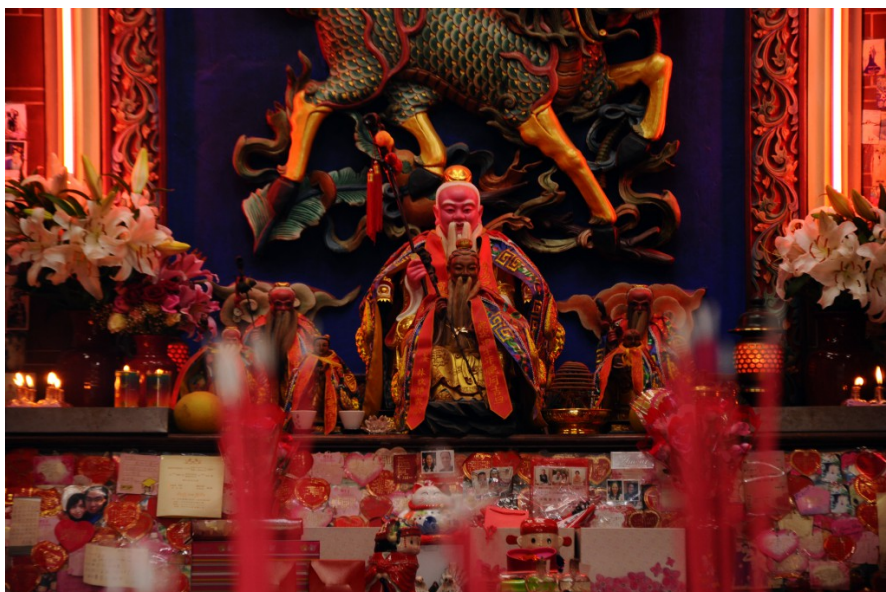
除了主神與陪祀神明之外，最受民眾歡迎的是月老廟，香火鼎盛。