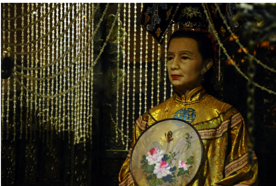
沿著一條密徑走入鄭再傳紀念博物館，一進門便見栩栩如生的慈禧太后蠟像，神情堅定嚴肅。