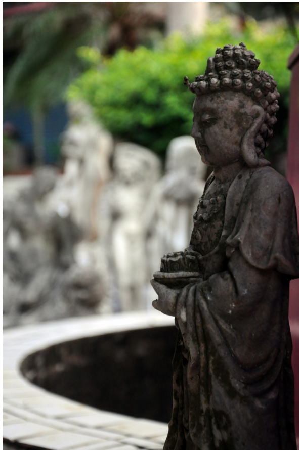
同一個園地內站著一尊非常小的釋迦牟尼像，和希臘眾神格格不入。