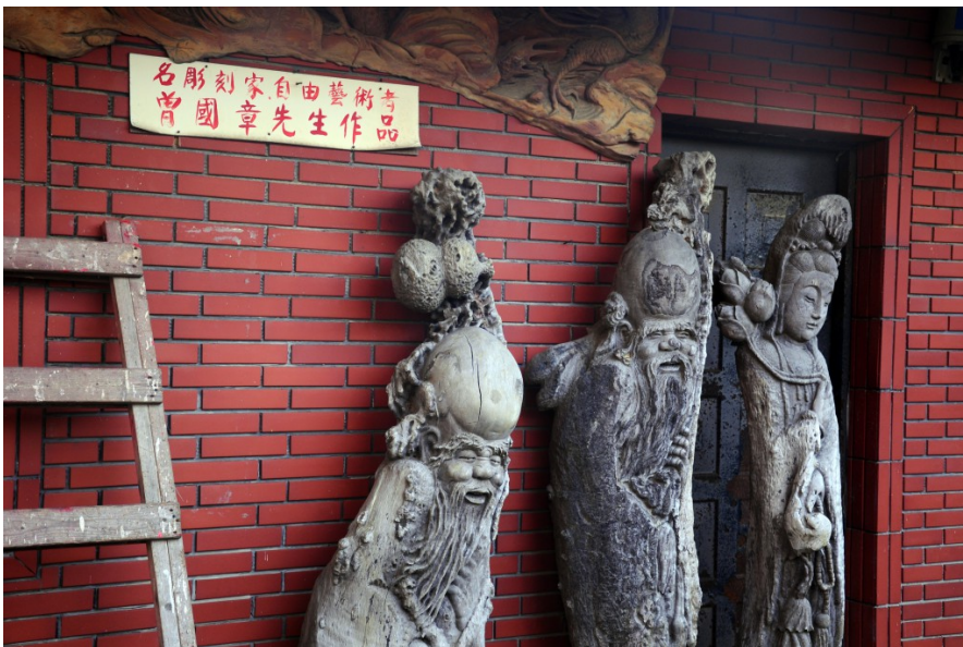
廟宇牆邊擺設著曾國章先生的雕刻作品，工藝精細，令人讚嘆。