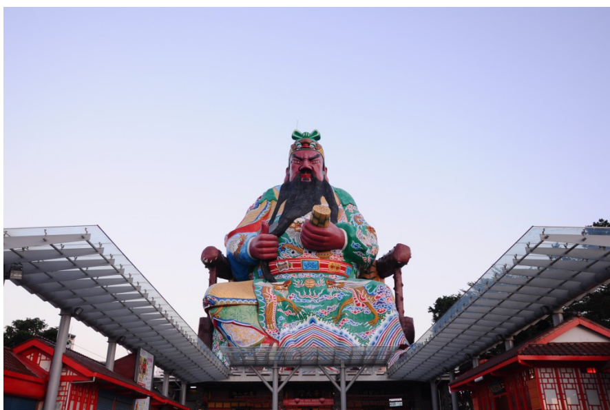
普天宮的主神關聖帝君像，高度一百二十公尺，嚴肅的臉龐配上比讚的大拇指，相當違和。

創建近五十年的普天宮，位於擁有風水寶地之美稱的新竹古奇峰上。未聞廟宇鐘聲，先見一百二十公尺高的關聖帝君神像威風凜凜地佇立在山腰，鎮守四方。但是這座寺廟不僅僅是普通的廟，裡頭除了供奉主神關聖帝君、陪祀文昌帝君以及呂仙祖，更聚集了十來座中外聞名的神像，如月老、四面佛、福德正神、註生娘娘等，分為十四處祭拜。民眾要拜完整座寺廟的神明，要花上好一段時間，隔壁更有鄭再傳紀念博物館供民眾免費參觀。廟宇周遭各種千奇百怪的景象林立，仔細走訪，可以看見埃及、希臘神像錯立，整座寺廟走一圈，散發著詭譎的氣息，卻又讓人看了入迷。