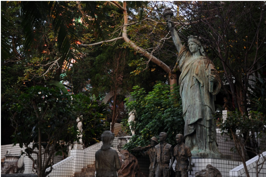
繼續向外走，卻看見自由女神像佇立在希臘眾神間，腳邊站著三個原住民人像，景象奇異。