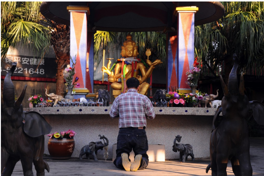
源自泰國的四面佛傳說中法力無邊，有求必應，但是祈願者除了必須內心虔誠，更需要在願望實現後回來還願，否則後患無窮。