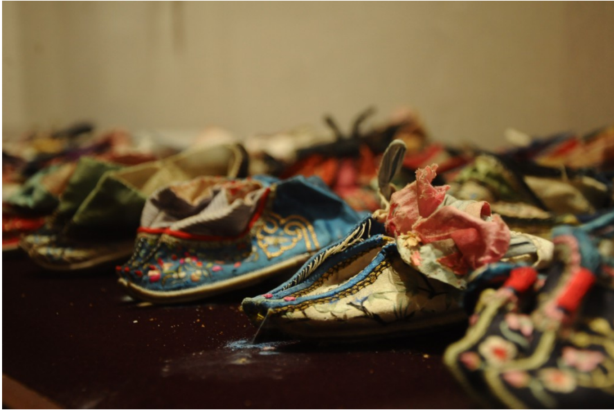
館內展示古時裹小腳的女人所穿的繡花鞋，數量與樣式之多，讓人驚訝。