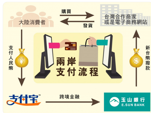
兩岸支付流程。

同年十二月，阿里巴巴旗下的「支付寶」順利和玉山銀行合作進駐台灣，令人不免質疑為什麼支付寶可以Paypal卻不行？但很顯然地即便支付寶登上台灣，和Paypal一樣，由於第三方支付專法的限制，台灣人兩者都不能使用，支付寶主要是提供來台灣的陸客一項便利的消費方式，省去換匯的麻煩，也為台灣商家帶來一定程度的經濟效益。